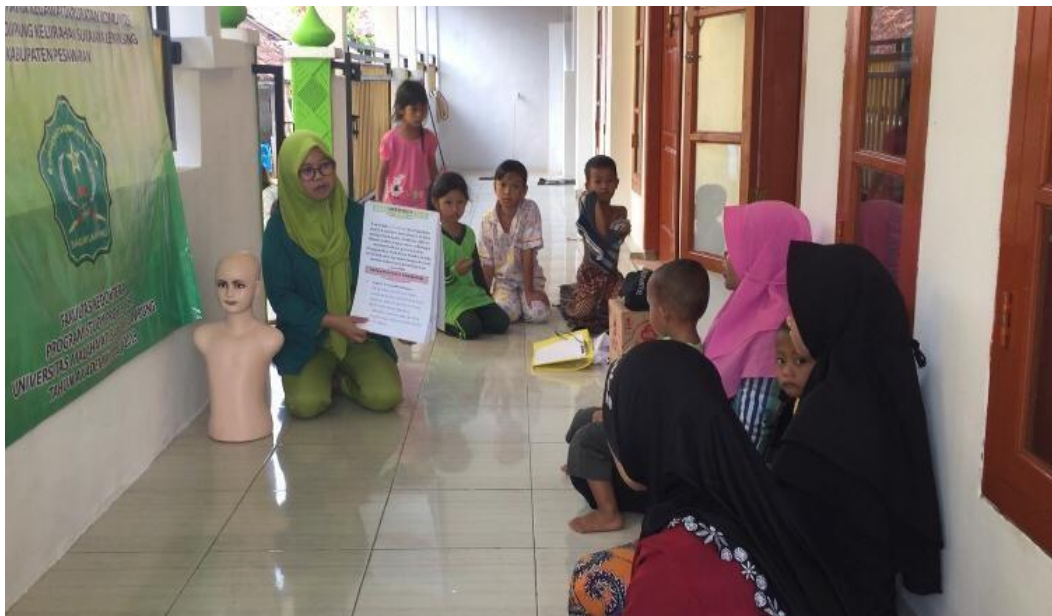
Gambar 4.1 Penyuluhan kesehatan tentang penanganan tersedak pada balita

Penyuluhan kesehatan tentang cara penanganan pertama resiko tersedak pada anak balita dilaksanakan pada hari kamis 16 mei 2019, pukul 15.00 s/d 16.00 jadwal ini sesuai dengan rencana penyuluhan kesehatan yang saya laksanakan telah diberi izin oleh kepala dusun 02 aryo jipang kelurahan sukajaya lempasing pesawaran, lampung selatan. Peserta penyuluhan yang hadir adalah sebanyak 6 orang ibu yang memiliki anak balita.berikut adalah gambar pelaksanaan penyuluhan.