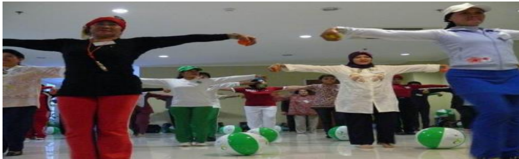
Gambar 1.2. Penyuluhan dan Senam Lansia Penderita Rematik Lansia

perawatan rematik, dan peserta bisa menyebutkan cara pencegahan agar rematik tidak kambuh. Berikut gambar pelaksanaan senam rematik lansia: