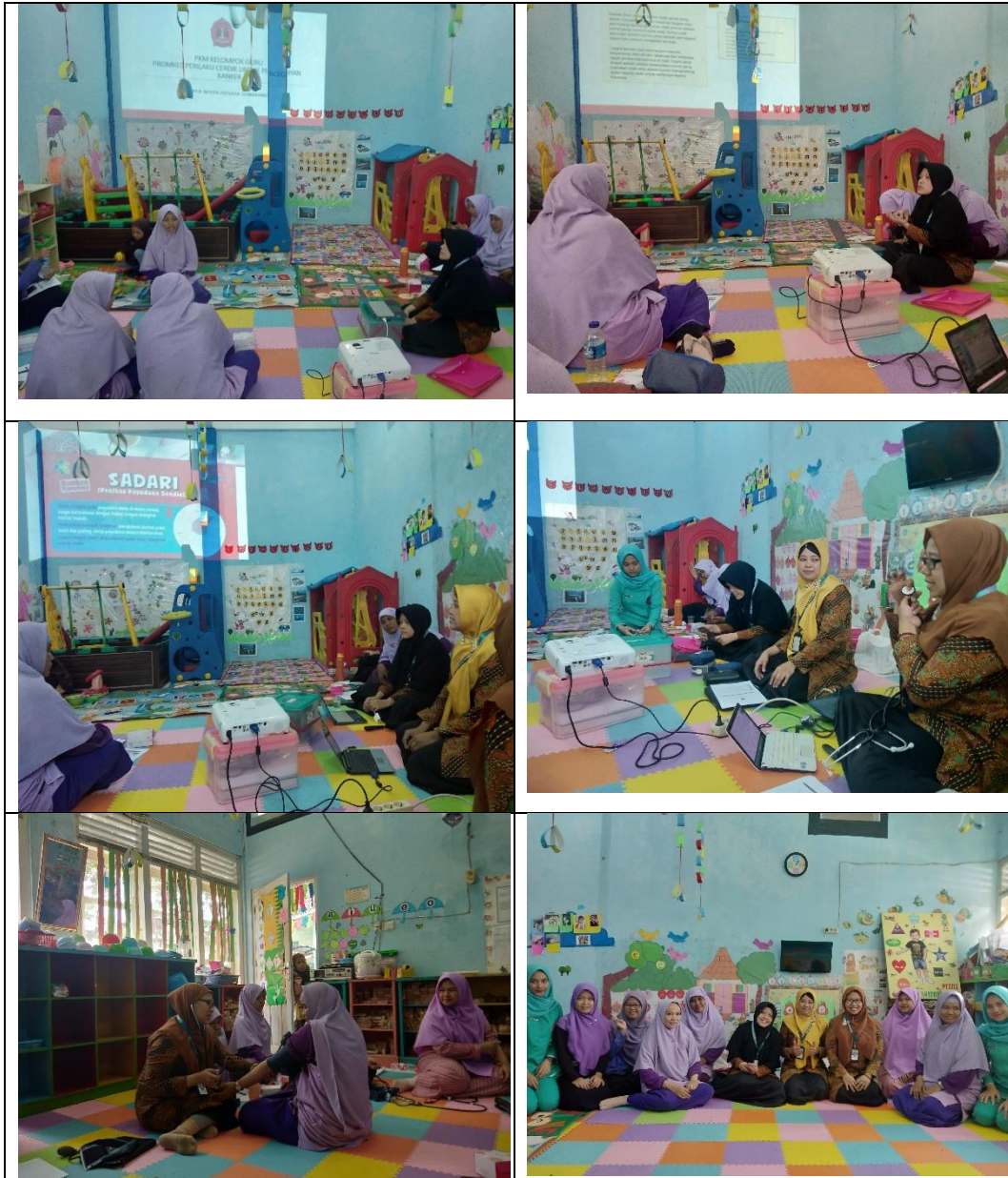
Gambar 2.2 Foto Kegiatan PKM