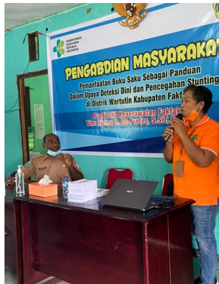
Gambar 2. Kegiatan Pemberian Materi

Distrik Wartutin termasuk ke dalam salah satu daerah prioritas penanggulangan stunting di Kabupaten fakfak. Hal ini menandakan kasus stunting balita di Kabupaten fakfak tergolong tinggi. Dalam upaya pencegahan dan penanggulangannya, dibutuhkan konvergensi dari berbagai pihak di berbagai tingkatan yang tidak hanya terbatas pada aspek kesehatan. Para stakeholder perlu memiliki pengetahuan dan persamaan persepsi terkait stunting agar upaya pencegahan dan penanggulangan kasus stunting dapat dilaksanakan secara jelas, terukur, terarah serta selaras.