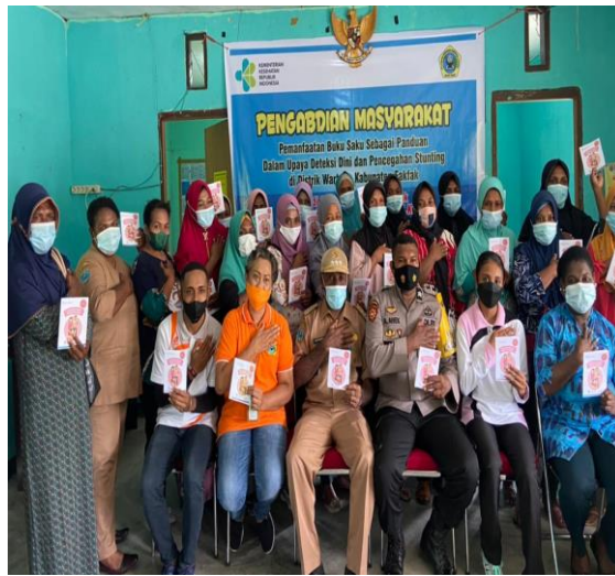
Gambar 3. Foto Bersama Peserta Kegiatan

Hasil kegiatan ini menunjukkan bahwa secara garis besar, pengetahuan mengenai stunting pada kader kesehatan di Distrik Wartutin mengalami peningkatan pasca pemberian edukasi gizi dengan media Buku Saku Mandiri. Hal ini dibuktikan melalui skor jawaban kader, dimana rerata skor post-test adalah 86,29 dan lebih tinggi dibandingkan skor pre-test yaitu 72,8. Presentase peningkatan pengetahuan kader kesehatan mengenai stunting meningkat 13.49% lebih tinggi dibandingkan sebelum diberi edukasi oleh Tim Pengabdian.