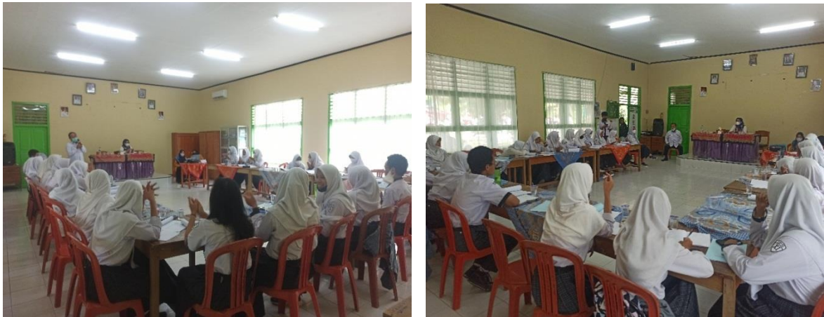
Gambar 3 Pre test kepada Siswa SMAN 4 Metro