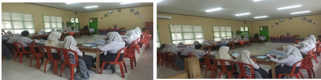
Gambar 2 Pre test kepada Kader Remaja UKS dan PMR