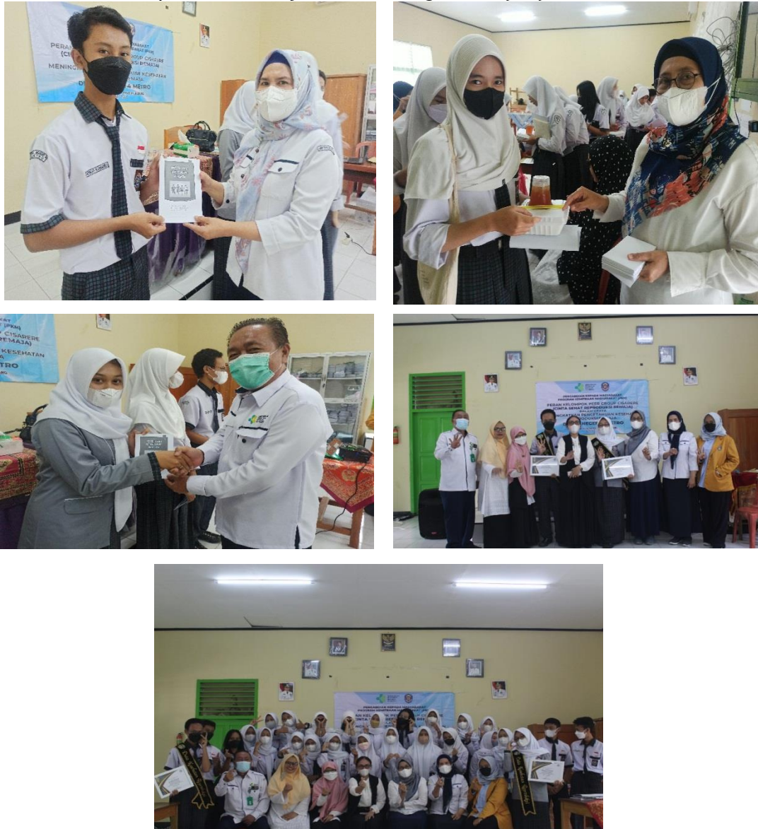
Gambar 9 Pembagian Luaran Pengabmas

Pada tahap outcome tim Pengabmas memilih duta kesehatan reproduksi kepada remaja yang terpilih mendapatkan skor pengetahuan baik dan keterampilan dalam diskusi selama kegiatan pengabmas ini, tujuan pemilihan duta kesehatan reproduksi ini adalah sebagai wadah untuk mengeksplor pengetahuan dan keterampilan serta pengetahuan siswa dalam dunia kesehatan reproduksi, dengan harapan duta kesehatan reproduksi remaja ini mampu menjadi pelopor, motivator dan teman curhat masalah kesehatan reproduksi remaja untuk kelangan sebayanya.