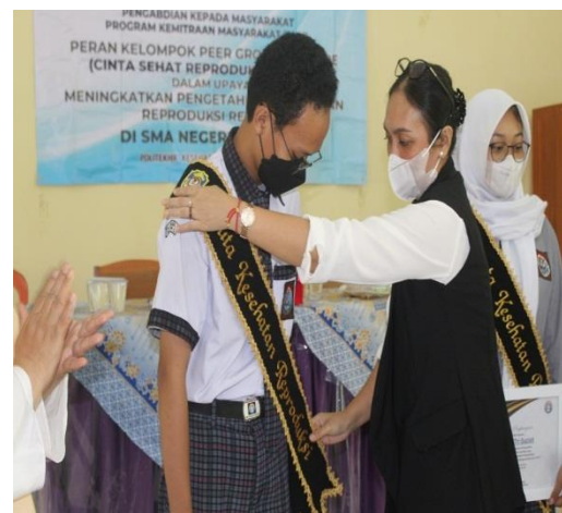
Gambar 8 Pemilihan Duta Kespro