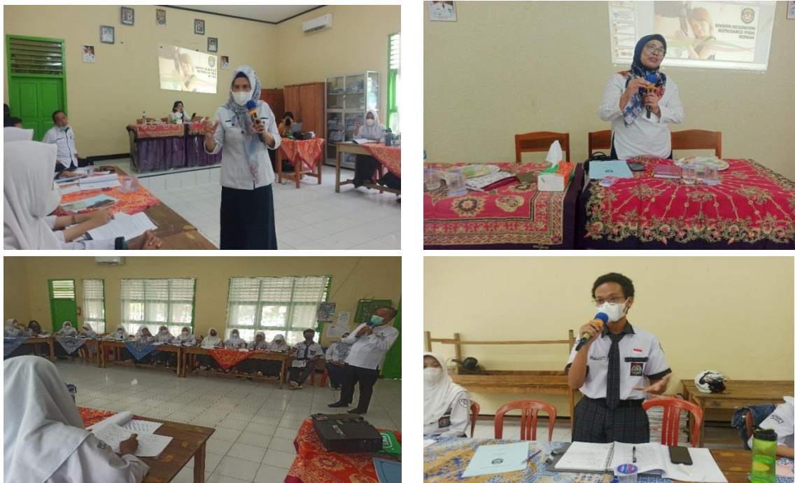
Gambar 4 Kegiatan Penyampaian materi

Kegiatan penyampaian materi diberikan kepada tim Pengabmas dan didampingi mahasiswa sebagai fasilitator dalam kegiatan Pengabmas ini, penyampaian materi diberikan setelah peserta/ kader kesehatan mengikuti pre test . Materi yang disampaikan berkaitan tentang kesehatan reproduksi remaja dan peran peer group remaja.