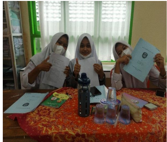
Gambar 7 Kegiatan Kelompok Peer Group Cisarere

Pada kegiatan ini diperoleh hasil Kader remaja UKS/PMR sedang melakukan edukasi kepada remaja/siswa lainnya di SMAN 4 Metro dengan membentuk kelompok peer group cisarere beranggotakan 3-7 orang setiap kelompoknya, hasilnya siswa saling bertukar informasi terkait kesehatan reproduksi dan cara mencegahnya, siswa dan kader remaja UKS/PMR terlihat antusias dan lebih kooperatif dalam kegiatan ini, sehingga hasil positif dari kegiatan ini diharapkan akan terus berlanjut dan remaja dapat lebih memperhatikan kesehatan reproduksinya dan cara penanganannya.