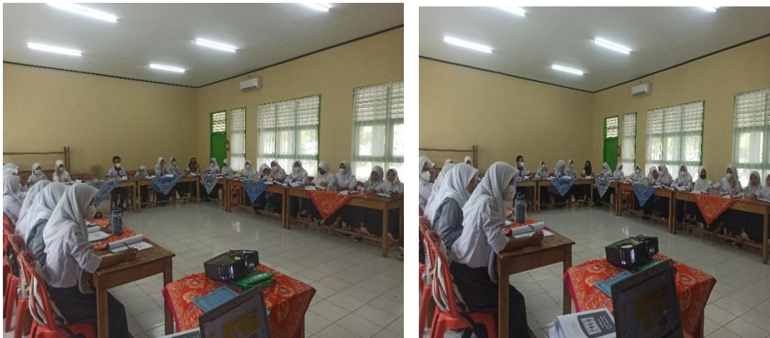
Gambar 6 Post test kepada Siswa SMAN 4 Metro