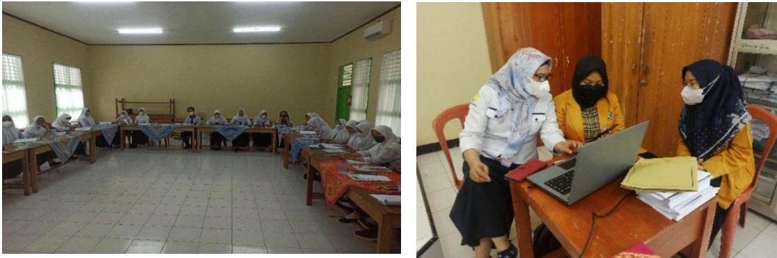
Gambar 5 Post test kepada Kader Remaja UKS dan PMR