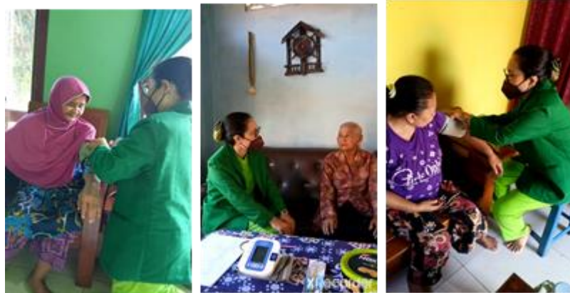
Gambar 2. Gambaran Kegiatan Pelaksanaan