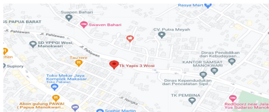
Gambar 2.1 Lokasi TK Yapis III Kabupaten Manokwari

Berdasarkan studi pendahuluan yang telah dilakukan oleh pengabdian di salah satu sekolah taman kanak-kanak Wilayah kerja Puskesmas Wosi yaitu dengan melakukan wawancara pada guru didapatkan data jumlah siswa/siswi di Taman kanak-kanan tersebut berjumlah sekitar 35 anak, selama ini telah diajarkan cara cuci tangan yang benar namun belum dapat diterapkan secara maksimal oleh anak-anak. Berdasarkan hasil observasi saat anak-anak melakukan pembelajaran luring pada saat itu yang diobservasi pada 10 orang anak, bahwa sebagian besar anak-anak tersebut belum tahu langkah-langkah cara mencuci tangan dengan benar dan belum mengetahui waktu yang tepat harus dilakukannya cuci tangan. Namun di lokasi mitra telah terdapat fasilitas sarana dan prasarana cuci tangan.