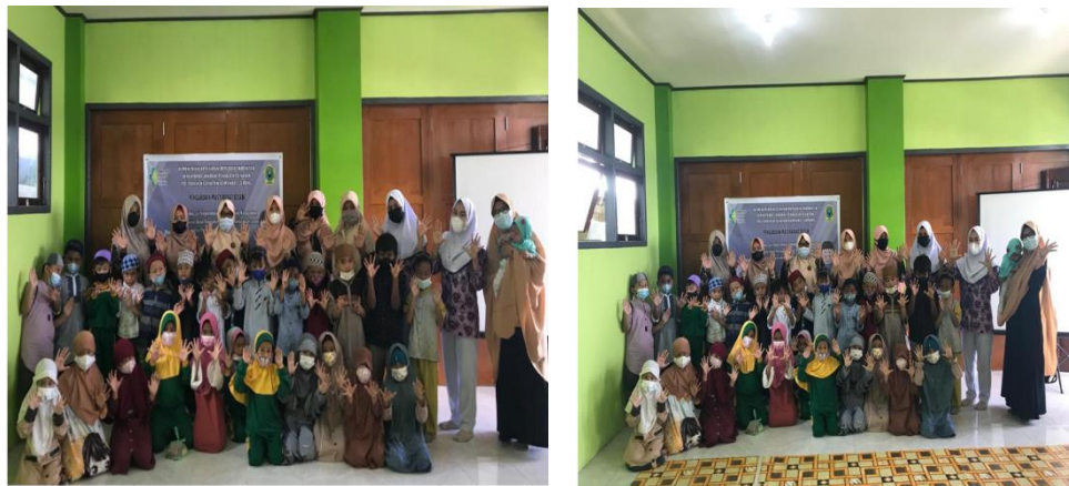
Gambar 1 - 2 Foto Kegiatan PKM