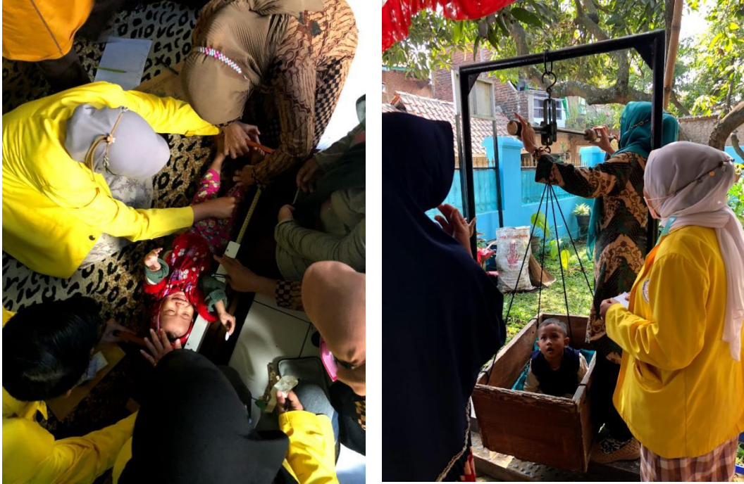
Gambar 3. Promosi Kesehatan kepada bayi dan balita dalam rangka Bulan Imunisasi Anak Nasional