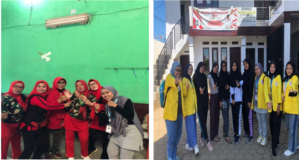
Gambar 5. Kegiatan Senam Sehat

Kegiatan senam sehat ini bertujuan untuk menjadikan tubuh menjadi sehat dan bugar. Selain itu, tujuan utamanya adalah untuk meningkatkan imunitas tubuh agar tidak mudah terpapar oleh penyakit.