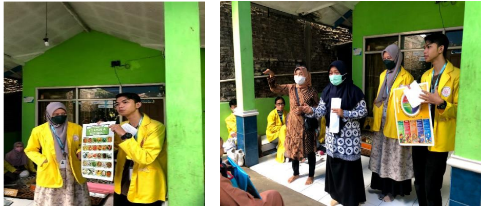
Gambar 2. Penyuluhan mengenai stunting kepada masyarakat RW 05

Penyuluhan di Posyandu RW. 05 Desa Rancaekek Kulon ini merupakan salah satu bentuk sosialisasi yang dilaksanakan bersama masyarakat wilayah program pengabdian kepada masyarakat ini, yaitu memberikan wawasan terkait pengetahuan tentang menangani dan mencegah stunting. Dalam penyuluhan ini pelaku pengabdian kepada masyarakat ini memberikan pemahaman serta edukasi kepada masyarakat setempat perihal stunting.