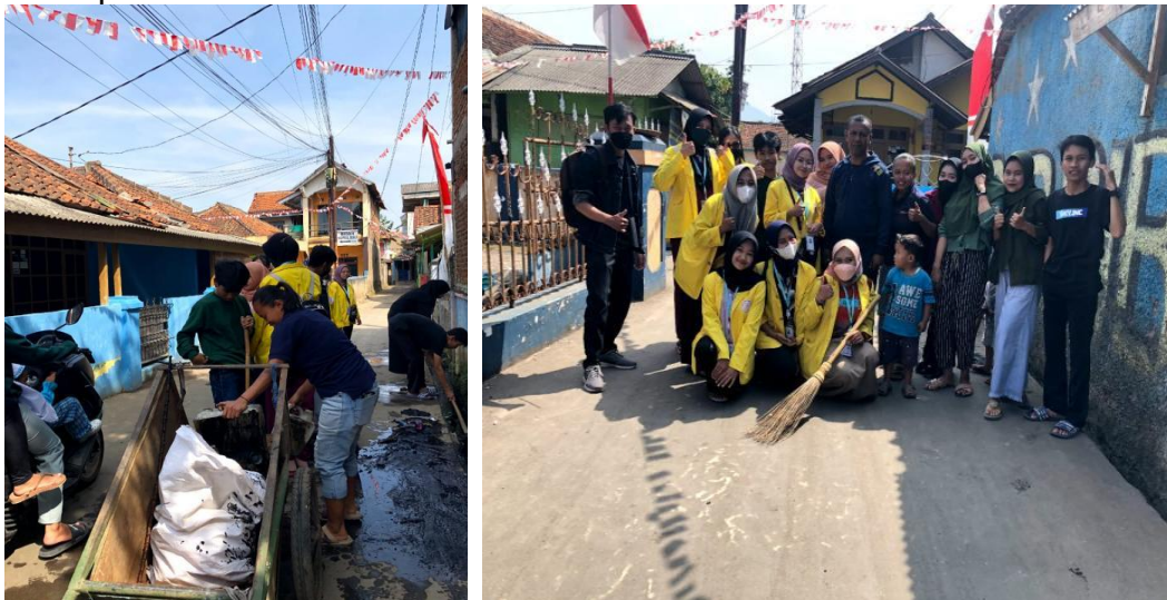
Gambar 4. Program Jum'at bersih bersama karang taruna RW. 05

Kegiatan Jum'at Bersih dilingkungan RW. 05 Desa Rancaekek Kulon ini bekerjasama dan dibantu oleh karang taruna setempat, yang dimana kegiatan ini bertujuan untuk menjadikan lingkungan bersih karena selalu terpelihara dan terawat.