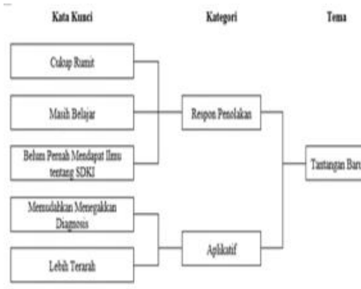
Gambar 1. Skema Tantangan baru

Lebih lengkapnya analisis tema dapat dilihat pada gambar berikut: