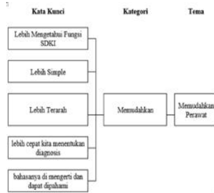
Gambar 2. Skema Memudahkan Perawat