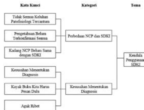
Gambar 3. Skema Kendala penggunaan SDKI

Lebih lengkapnya analisis tema dapat dilihat pada gambar berikut: