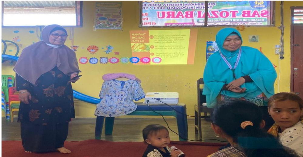
Gambar 4.1 Penyuluhan Inisiasi Menyusui Dini (IMD) Pada Ibu Trimester III.

Hasil dari kegiatan ini untuk menambah informasi dan pengetahuan pada ibu hamil trimester III tentang pentingnya inisiasi menyusui dini serta tehnik pelaksanaannya. Begitu juga adanya feedback yang positif pada pihak puskesmas dalam mengikuti kegiatan dan dalam kerja samanya yang menyiapkan ibu trimester III dan tempat pelaksanaan. Hasil pretest ibu hamil tentang IMD 16,6% diartikan masih kurangnya pengetahuan ibu tentang inisiasi menyusui dini, setelah dilakukan penyuluhan hasil posttest tentang pengetahuan IMD didapati 88,33% diartikan adanya peningkatan pengetahuan ibu tentang inisiasi menyusui dini sedangkan hasil pengetahuan pada saat posttest dengan nilai rendah sebanyak 16,6% disebabkan karena ada ibu hamil tidak datang pada saat dilakukan penyuluhan Inisiasi Menyusui Dini.