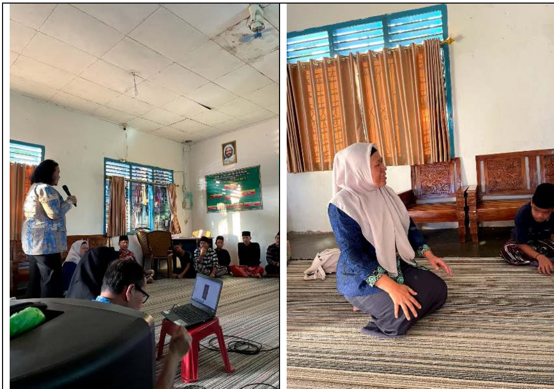
Penyampaian Materi Oleh Dosen Tim Pengabmas Poltekkes Tanjungkarang