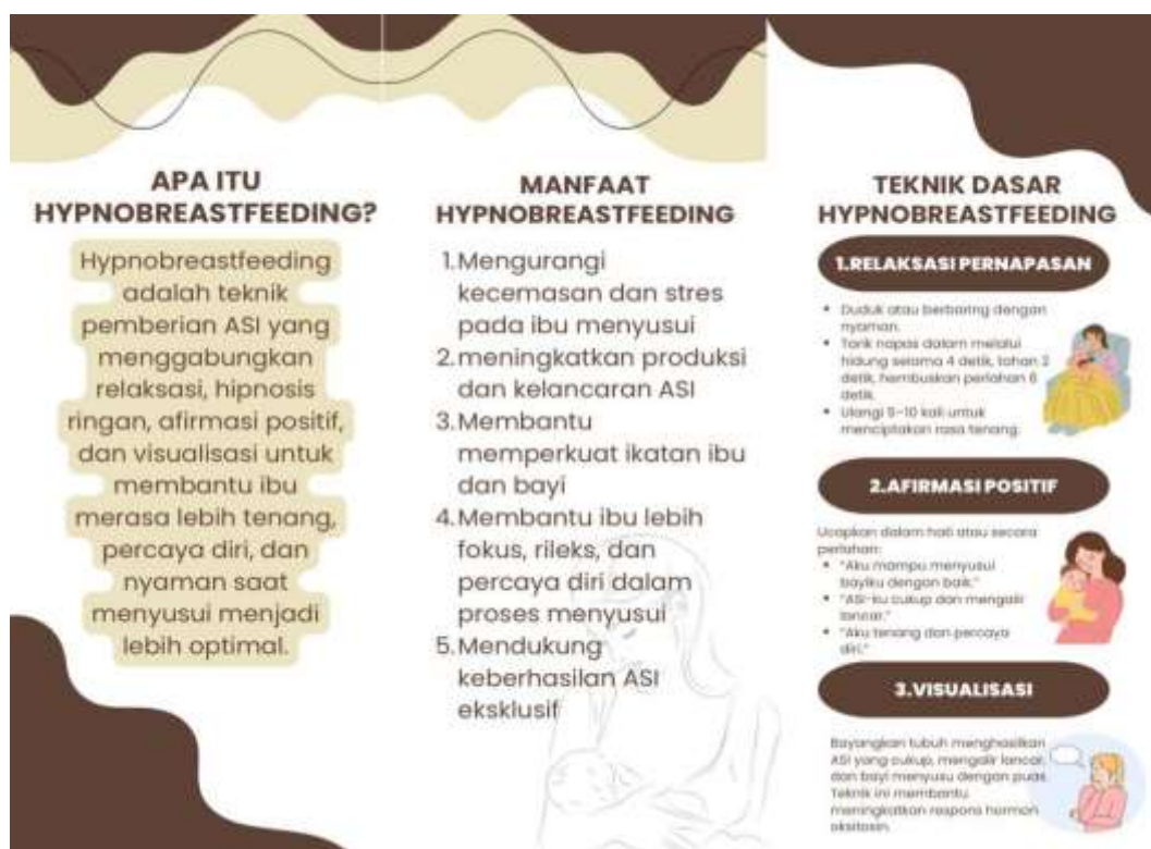
Gambar 3. Leaflet kegiatan