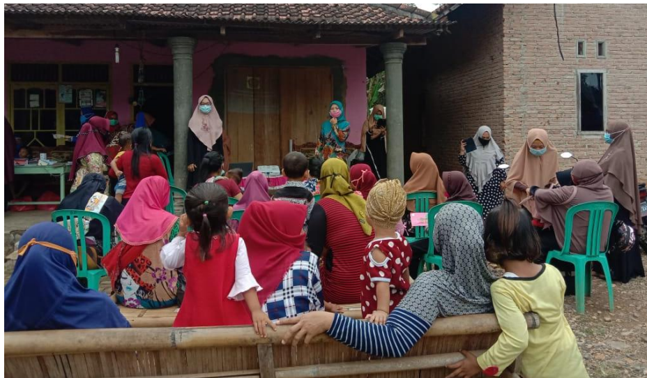
Gambar 4.1 Edukasi: penyuluhan pentingnya menjaga personal hygiene pada saat kehamilan

Peserta cukup antusias terhadap materi yang diberikan. Upan balik yang diberikan- pun cukup positif. Terdapat beberapa pertanyaan dan sanggahan dari peserta penyuluhan terkait materi. Materi penyuluhan dapat diterima dengan baik, terbukti dengan adanya peningkatan pengetahuan peserta sebesar (50%) dimana sebelum materi disampaikan kemampuan menjawab dengan benar sebesar 30% sedangkan setelah materi disampaikan kemampuan menjawab peserta meningkat menjadi 80%.