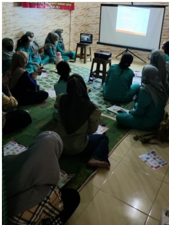
Gambar 2. Kondisi Penyuluhan

Dari kegiatan penyuluhan tersebut, ibu hamil mendapatkan manfaat yang besar secara individu maupun sosial dalam mengatasi mual muntah yang terjadi selama kehamilan trimester 1 dengan menggunakan tehnik akupresur. Akupresur ini dapat dilakukan dimana saja ibu berada, pengaplikasian yang mudah dan tanpa biaya.