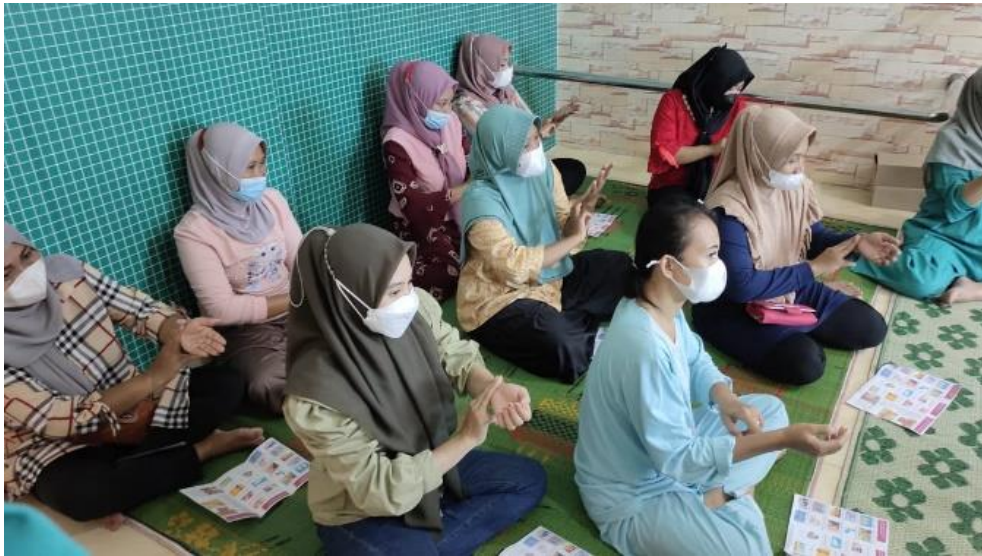
Gambar 4. Praktek akupresur bersama semua ibu hamil

Kegiatan yang dilakukan berlangsung sangat baik, sebanyak 90% peserta terjadi peningkatan pengetahuan tentang cara mengatasi mual mual pada ibu hamil trimester I dengan menggunakan tehnik akupresur serta terjalin kerja sama yang baik antara mahasiswa dengan peserta