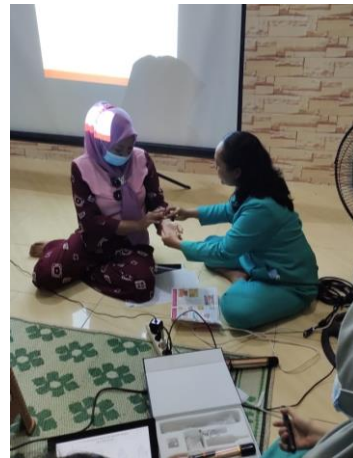
Gambar 3. Praktik Akupresur