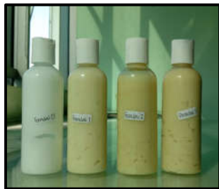
Gambar 2. Sediaan Lotion Ekstrak Biji Petai Cina

Aroma yang dihasilkan yaitu untuk formulasi 1 dan formulasi 2 beraroma biji petai cina dan formulasi 3 khas biji petai cina. Dari hasil pengujian fisik uji organoleptis bentuknya semi padat, warna dan bau sesuai dengan konsentrasi ekstrak yang dikandungnya, sehingga hasil ini dapat memenuhi syarat.