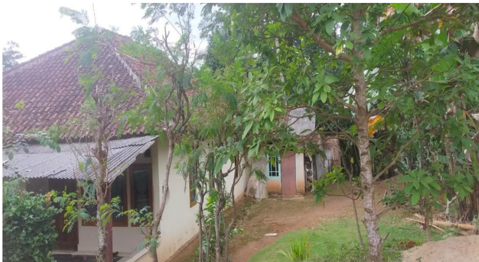
Gambar 3. Rumah Warga