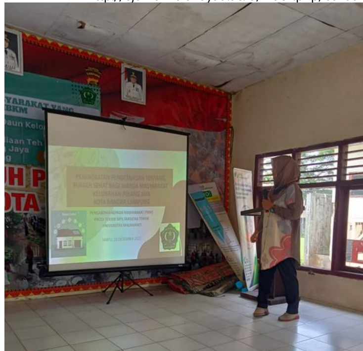
Gambar 5. Penyampaian Materi Penyuluhan