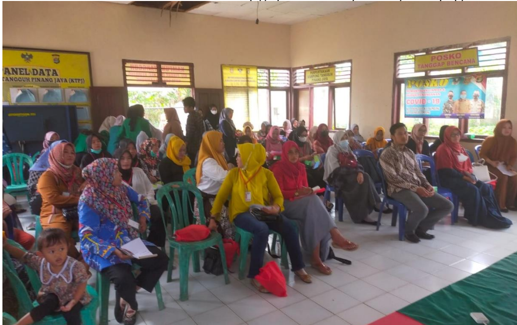
Gambar 7. Peserta Penyuluhan Warga Masyarakat