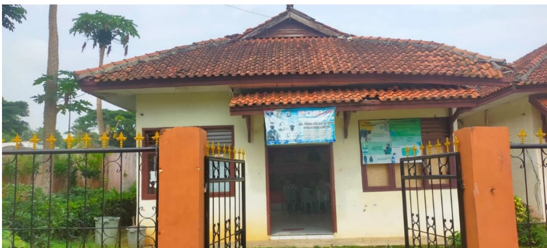
Gambar 4. Aula Keluran Pinang Jaya Tempat Dilaksanakan Kegiatan PKM

Penyampaian materi penyuluhan berupa Pengetahuan Tentang Rumah Sehat kepada masyarakat dilakukan dengan menggunakan PPT paparan materi dan video/animasi rumah sehat. Warga masyarakat di Kelurahan Pinang Jaya Kota Bandar Lampung berperan aktif selama pelaksanaan penyuluhan dengan memperhatikan dan banyak bertanya tentang paparan materi yang disampaikan oleh nara sumber yaitu ketua kegiatan Pengabdian Kepada Masyarakat (PKM). Selaian paparan materi nara sumber juga menampilkan video/animasi contoh bagian-bagian dari rumah sehat sehingga warga masyarakat lebih paham dan bertambah pengetahuannya tentang Rumah Sehat.