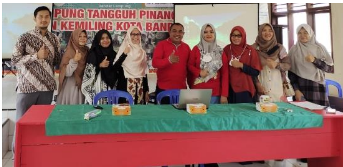
Gambar 6. Tim PKM dan Pihak Kelurahan