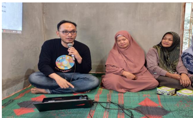
Gambar 4. Fasilitator Menjelaskan Mengenai WPS Office