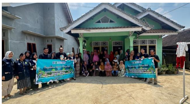
Gambar 5. Foto Bersama dan Penutupan Pengabdian