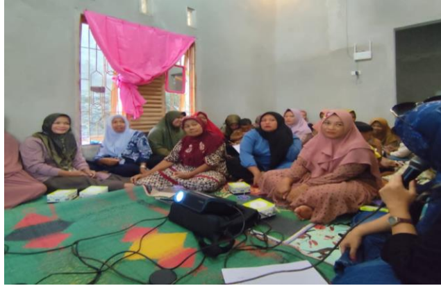
Gambar 3. Ibu-ibu PKK yang menjadi peserta

Hasil yang dicapai dalam kegiatan pengabdian ini, yaitu :