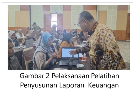
Gambar 2 Pelaksanaan Pelatihan Penyusunan Laporan Keuangan

knowledge kepada BUM Desa lain di wilayahnya. Monitoring dilakukan oleh DPMD Provinsi dan Kabupaten serta Forum BUM Desa sebagai mitra pengabdian di Jawa Timur. PKN STAN mendampingi melalui community of practice via WA group.