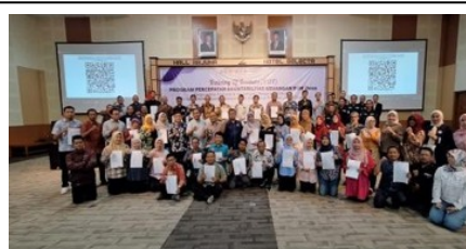
Gambar 3 Dokumentasi selesai pelatihan. Peserta berhasil mendokumentasikan pembukuan dan penyusunan laporan keuangan