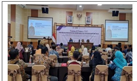
Gambar 1 Pembukaan kegiatan oleh Kabid PUED DPMD Jawa Timur

terjalin sejak tahun 2021 telah memberikan kontribusi positif terhadap penguatan kinerja BUM Desa di Jawa Timur. Lebih lanjut, disampaikan pula bahwa berbagai program strategis akan terus dilaksanakan guna mendorong penguatan ekonomi desa, di antaranya Program Paman Desa (Penguatan Permodalan BUM Desa), BUM Desa Auditable (Penyusunan Laporan Keuangan), Pasar Desa (Penguatan Kapasitas Pasar Desa), serta Jempol Ibu (Bimbingan Teknis Penanganan Permasalahan BUM Desa). Secara khusus, program BUM Desa Auditable dilaksanakan dengan pendampingan dari PKN STAN.