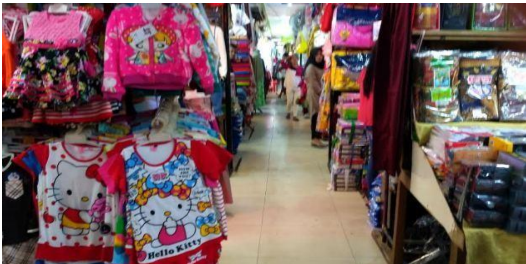
Gambar 2.2 Pedagang yang berada di dalam Pasar BK