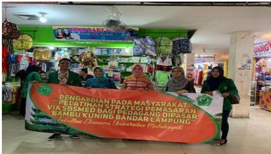
Gambar 3.1 Pelatihan di Pasar bambu Kuning

Berikut adalah gambar - gambar pelatihan: