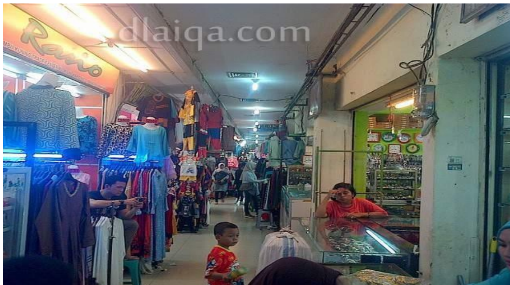
Gambar 2.3 Pedagang yang berada di dalam Pasar BK (Sumber: Google.co.id, diakses 17 Februari 2018)

(Sumber: Google.co.id, diakses 17 Februari 2018)