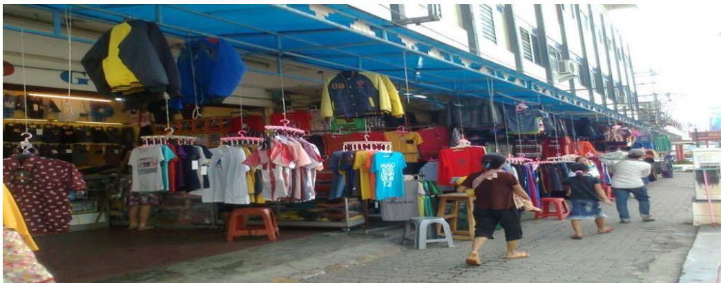
Gambar 2.1 Pedagang yang berada di luar Pasar BK

Berikut adalah gambaran umum pedagang di pasar Bambu Kuning Bandar Lampung :