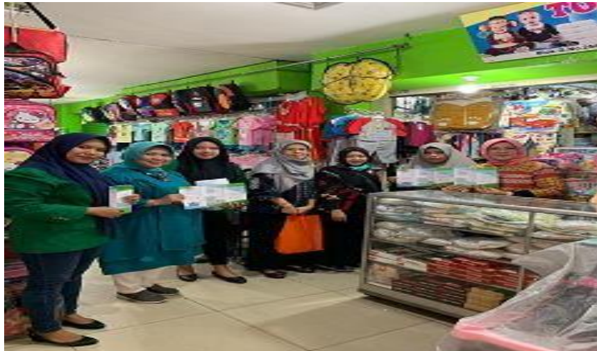
Gambar 3.2 Pelatihan di Pasar bambu Kuning