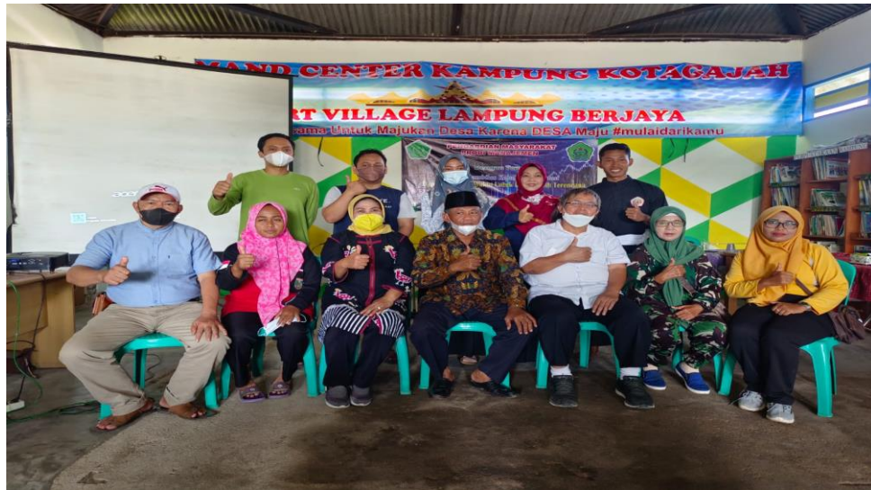
2.3 foto bersama ketua karang taruna, ketua pkk, Dekan Fakultas Ekonomi Dan Kaprodi Manajemen