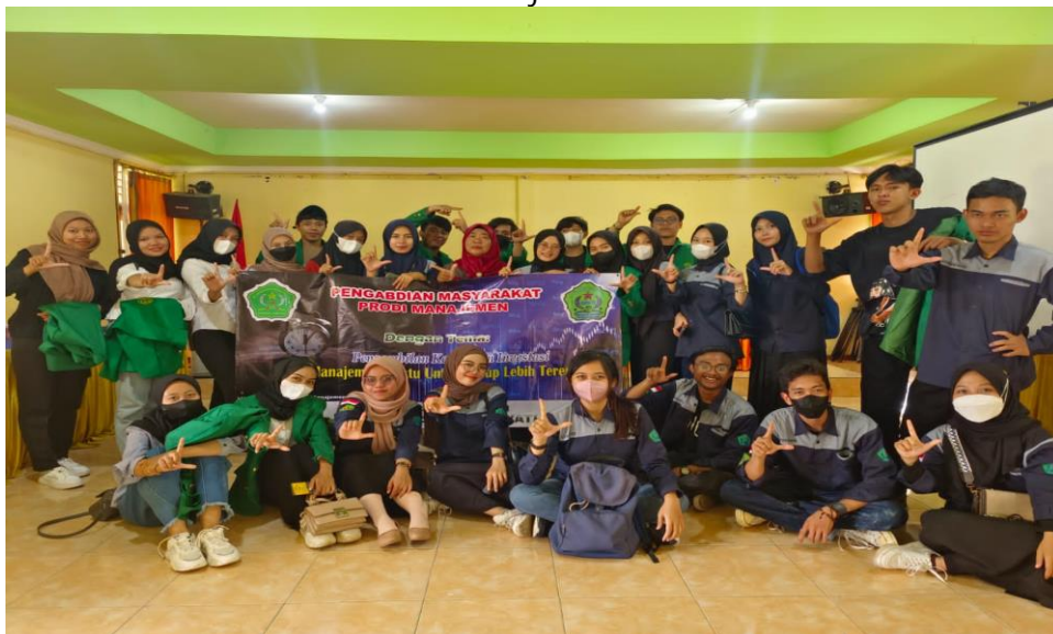
Foto bersama mahasiswa fakultas ekonomi manajemen