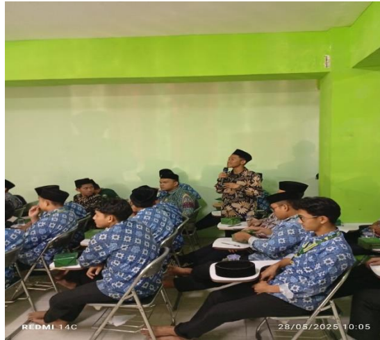
Gambar 2 Diskusi Interaktif antara pemantik dan partisipan

Metode Ceramah dipilih berdasarkan beberapa riset yang membuktikan efektifitas metode ceramah antara lain: Pemantik dapat berinteraksi langsung dengan audiens (Asmedy, 2021), dapat memberikan penjelasan bahan pelajaran yang sukar dalam waktu relatif singkat (Fatmawati, 2018). serta menumbuhkan minat belajar dari sumber lain (Harapan, 2018). Selain itu dengan metode ceramah juga pemantik dapat mengkaitkan isu hukum yang sedang trend sebagai bahan Ajar (Huda, 2024), agar lebih mudah dipahami oleh audiens. Selain Ceramah, Pengabdian masyarakat juga menggunakan diskusi interaktif yang memiliki beberapa keunggulan yaitu, pada saat pembelajaran siswa/i ikut berpartisipasi secara langsung, serta ketika didalam ruang siswa/i tidak merasa jenuh, suntuk serta mengantuk ketika pemaparan materi berlangsung (Febnasari, 2010).