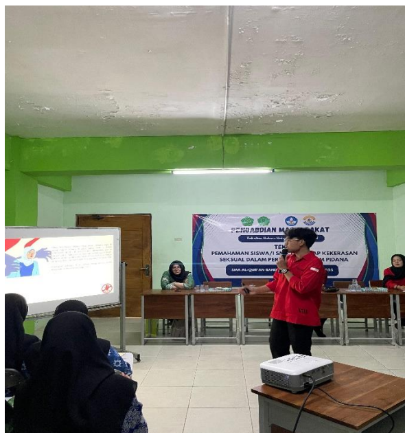
Gambar 1 Ceramah menggunakan media PPT oleh pemantik

Upaya untuk meningkatkan pemahaman siswa/i dilakukan dengan cara Ceramah serta diskusi interaktif antara pemantik dan juga partisipan. Hasilnya sangat memuaskan, ditemukan peningkatan pemahaman siswa/i SMA Bandar Lampung terkait pemahaman terhadap kekerasan seksual yang dapat dilihat pada hasil post test pada grafik 2.