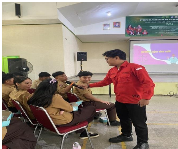
Gambar 1 Tanya Jawab Menggunakan Media PPT oleh Pemantik

siswa dalam kegiatan yang berkaitan dengan edukasi hukum atau politik praktis. Rendahnya pengetahuan siswa bukan berarti mereka tidak tertarik pada isu ini. Justru sebaliknya, mayoritas siswa menunjukkan antusiasme yang tinggi saat diberikan ruang dialog dan kesempatan untuk belajar melalui pendekatan yang interaktif dan menyenangkan. Permasalahan utamanya lebih mengarah pada kurangnya akses terhadap informasi hukum yang relevan, tidak terbukanya ruang diskusi di sekolah terkait isu kepemiluan, serta belum terintegrasinya materi hukum pemilu dalam kurikulum pendidikan. Sebagai solusi, Fakultas Hukum Universitas Malahayati melaksanakan kegiatan edukasi melalui ceramah dan diskusi aktif. Metode ini memungkinkan siswa terlibat secara langsung dalam memahami substansi pengawasan pemilu dan dampaknya bagi demokrasi. Berdasarkan hasil post-test yang dilakukan setelah sesi edukasi, ditemukan peningkatan signifikan dalam tingkat pemahaman siswa terhadap materi yang disampaikan. Grafik hasil akhir menunjukkan banyak siswa yang awalnya tidak paham, kini berada pada kategori "cukup paham" hingga "paham", yang menjadi indikator bahwa pendekatan yang digunakan berhasil dan tepat sasaran