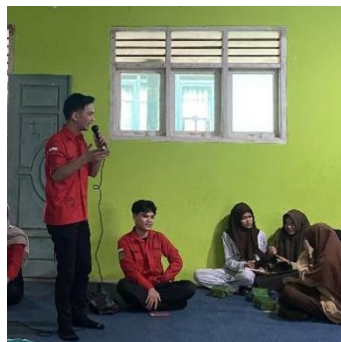
Gambar 1 Penyampaian Materi

Berdasarkan hasil analisis data yang diperoleh dari angket post-test, diketahui bahwa 57% siswa menyatakan telah memahami materi yang disampaikan dengan baik, 30% menyatakan cukup memahami, dan 13% menyatakan belum memahami materi secara menyeluruh. Temuan ini menunjukkan bahwa sebagian besar peserta mampu menyerap informasi yang diberikan selama kegiatan penyuluhan berlangsung. Pemahaman yang tinggi ini dapat diartikan sebagai keberhasilan metode penyampaian yang digunakan, yaitu pendekatan interaktif dan komunikatif yang memungkinkan siswa terlibat secara aktif dalam proses pembelajaran.