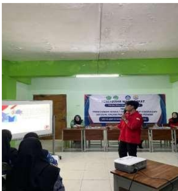
Gambar 1 Ceramah menggunakan media PPT oleh pemantik

Berdasarkan hasil Pre Test sebagian besar siswa sebelumnya belum memiliki pemahaman yang komprehensif mengenai kekerasan seksual hanya 12 % persen saja yang memiliki pemahaman terkait kekerasan seksual. Namun, Setelah mengikuti pemaparan yang sistematis dan berbasis hukum, ada peningkatan pemahaman menjadi 82 % persen. Pemberian Pemahaman pada siswa/i SMA Al-Quran dengan metode ceramah dan diskusi interaktif