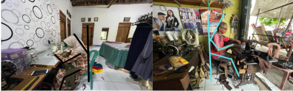
Gambar 2. Gambar postur duduk Responden I dan II

menjahit. Berikut merupakan gambaran postur kerja yang dilakukan oleh para responden dalam penelitian: