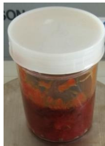
Gambar 1. Ekstrak kental biji buah alpukat

Hasil dari perendaman disaring dengan menggunakan kerta saring, sehingga didapatkan ekstrak cair biji buah alpukat. Dilanjutkan ke tahap selanjutnya agar didapatkan ekstrak kental biji buah alpukat. Sebanyak 1200 gram simplisia kering serbuk biji buah alpukat diperoleh 50,68 gram ekstrak kental atau 4,2%b/b. Ekstrak kental yang didapat berwarna coklat gelap yang berupa pasta kental dan bagian atas ekstrak berupa cairan kental (seperti minyak).