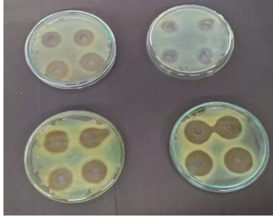
Gambar 1. Hasil Uji daya hambat ekstrak pada konsentrasi (I) 25%, (II) 50%, (III) 75% dan (IV) 100% terhadap bakteri Pseudomonas aeruginosa

(p) = 0.000 yang artinya ekstrak metanol daging buah kawista pada penelitian ini mampu menghambat pertumbuhan bakteri Pseudomonas aeruginosa .