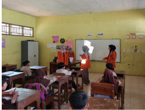
Gambar 3. Suasana penyuluhan kesehatan

Peningkatan pengetahuan siswa dan siswi di SDN 02 Tambaksari adalah suatu hal yang sangat positif dalam mengajarkan gaya hidup sehat kepada anak-anak. Salah satu contoh yang penting dalam perilaku hidup bersih dan sehat di sekolah adalah konsumsi jajanan sehat. Menurut (Menteri Kesehatan Republik Indonesia, 2016), contoh tindakan menjaga kebersihan dan kesehatan di lingkungan sekolah meliputi mencuci tangan menggunakan air yang bersih dan mengalir, mengonsumsi makanan sehat di sekolah, menggunakan fasilitas kamar mandi yang terjaga kebersihannya, tidak merokok di area sekolah, melaksanakan pengukuran berat badan dan tinggi badan setiap 6 bulan, serta membuang sampah sesuai tempatnya. Karena jajanan sehat merupakan salah satu contoh perilaku hidup bersih dan sehat di sekolah, penting bagi siswa untuk memiliki pemahaman yang kuat tentang risiko bahaya jajanan yang tidak sehat agar dapat menjaga kesehatan mereka (Lina, 2017). Untuk memastikan siswa memilih jajanan yang sehat, peran sekolah dalam meningkatkan penyuluhan dan membiasakan siswa untuk selalu mengonsumsi jajanan sehat sangatlah penting.