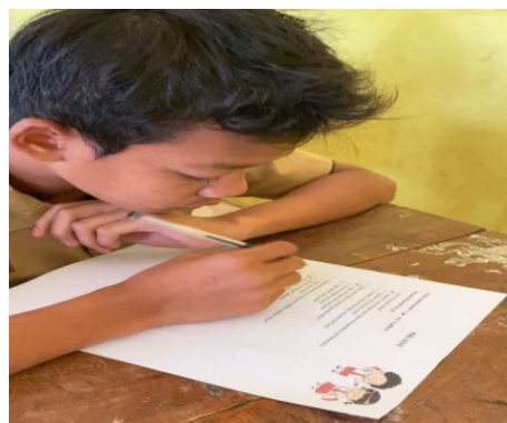
Gambar 2. Pelaksanaan pre-test

Berdasarkan tabel 2, dapat dilihat bahwa pengetahuan dan pemahaman siswa meningkat sebelum dan sesudah penyampaian materi. Hal ini dinilai baik karena para siswa memahami dan memperhatikan materi penyuluhan yang disampaikan. Penyuluhan kesehatan adalah upaya terencana untuk menyebarkan informasi dan membangkitkan keyakinan agar masyarakat sadar, mengetahui dan bersedia memberikan informasi yang diharapkan dapat meningkatkan kesehatan, mencegah penyakit dan memelihara kesehatan. Penyuluhan ini bertujuan untuk meningkatkan pengetahuan anak tentang jajanan sehat, dan pentingnya edukasi untuk merubah perilaku anak agar lebih bisa memilih antara jajanan sehat dan tidak. Gambaran pelaksanaan Pre- test dan Post -test dapat dilihat pada Gambar 2 dan Gambar 3.