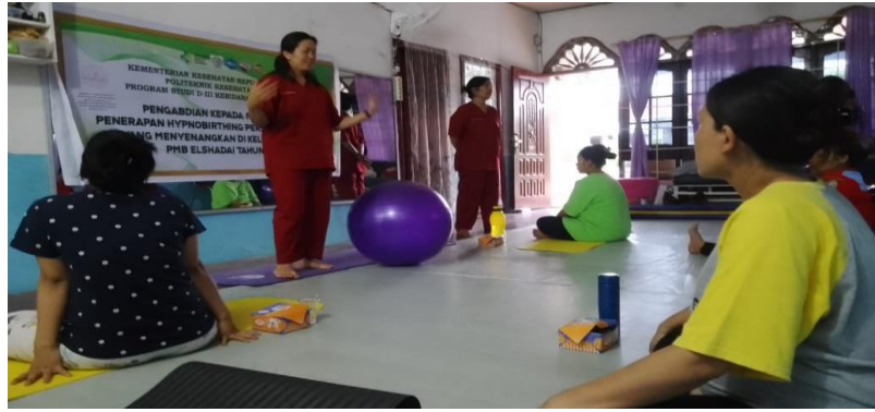
Gambar 2. Pemaparan Materi Pelatihan Penerapan Hypnobirthing