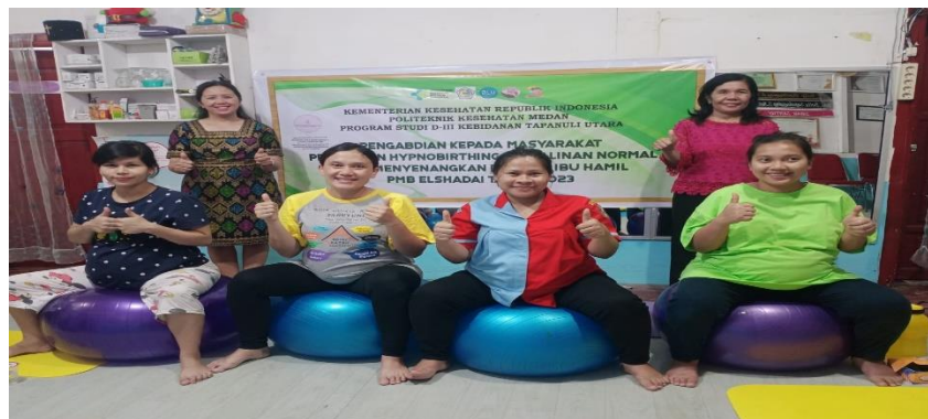
Gambar 4. Setelah pelatihan Penerapan Hypnobirthing

Setelah dilaksanakan sosialisasi dan pelatihan tentang Hypnobirthing , pengetahuan Ibu hamil tentang Hypnobirthing meningkat. Kegiatan menjadi positif awalnya ragu dan takut untuk dilakukan Hypnobirthing menjadi semangat, ibu hamil merasa lega, kecemasan tentang kehamilan persalinan berkurang setelah dilakukan Hypnobirthing