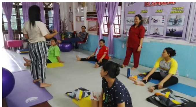
Gambar 3. Pelaksanaan pelatihan Penerapan Hypnobirthing