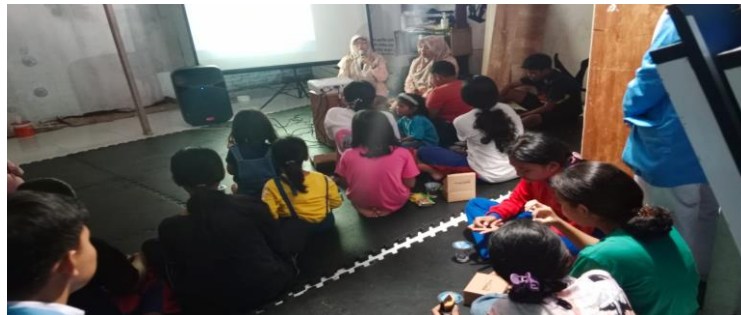
Gambar 2. Peserta mendengarkan pemaparan materi

Foto kegiatan penyuluhan dapat dilihat pada Gambar 2,3, dan 4