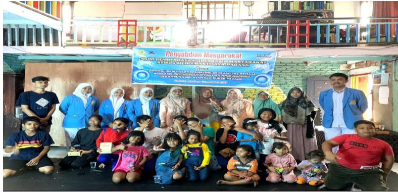
Gambar 4. Foto bersama tim pengabdian dan peserta