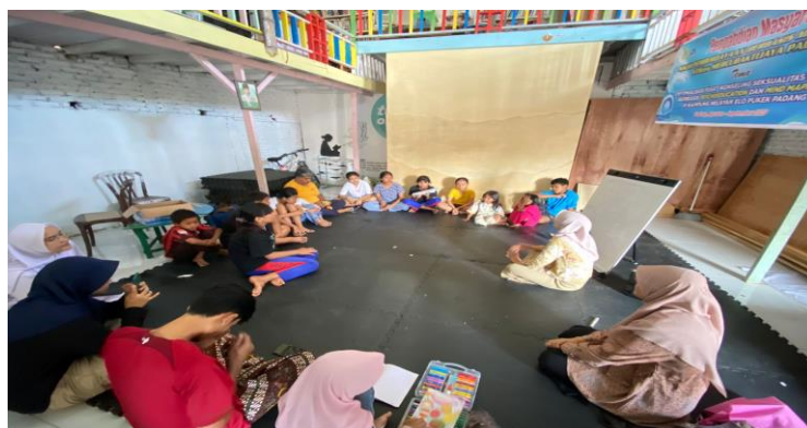
Gambar 3. Penjelasan materi mind mapping dan praktek