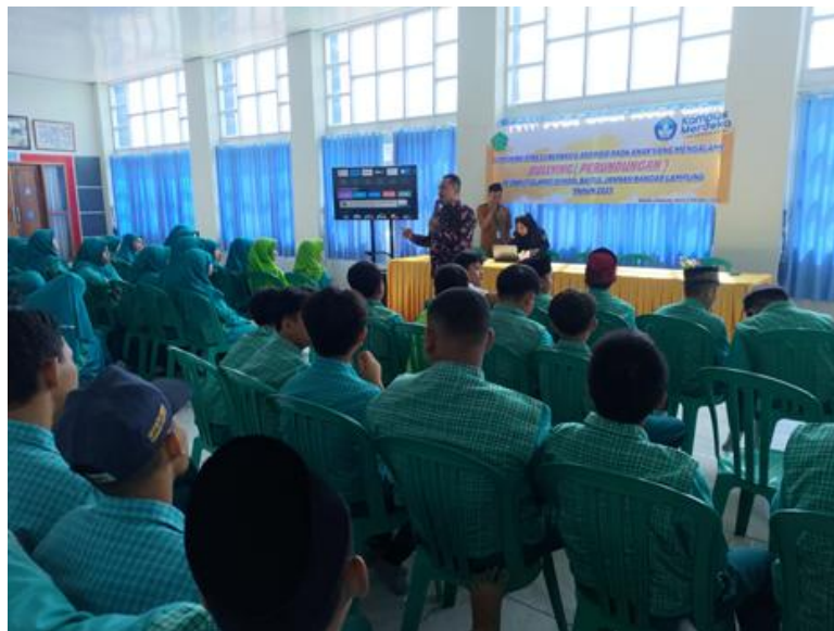
Gambar 2. Foto kegiatan

Pemberian materi dengan metode ceramah menampilkan PPT yang sudah disiapkan. kegiatan berjalan dengan lancar dan peserta tampak fokus memperhatikan materi. Selanjutnya dilakukan pengimplementasian aplikasi screening stress bullying kepada siswa yang berjumlah 60 orang dengan mengakses aplikasi dan menceklis kuesioner screening stress yang berisi kuesioner DASS berjumlah 40 soal untuk mendeteksi apakah siswa mengalami depresi, kecemasan atau stress. Setelah selesai siswa dapat langsung melihat hasilnya.