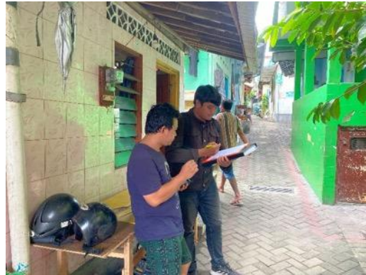
Gambar 5. Wawancara, Pengisian Kuisisioner, Dan Sosialisasi Dengan Salah Satu Warga Kelurahan Tegalrejo

Sampling wawancara, pengisian kuisisioner, dan sosialisasi mengenai kesiapsiagaan masyarakat dilakukan di 18 kelurahan dalam menghadapi bencana banjir dan longsor.