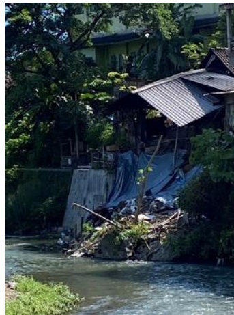
Gambar 2. Tebing Sungai Yang Longsor Di Lokasi Pengabdian

Survei lapangan dilakukan untuk mengetahui kondisi lapangan, bencana yang pernah terjadi, dan potensi bencana yang mungkin terjadi di kemudian hari.