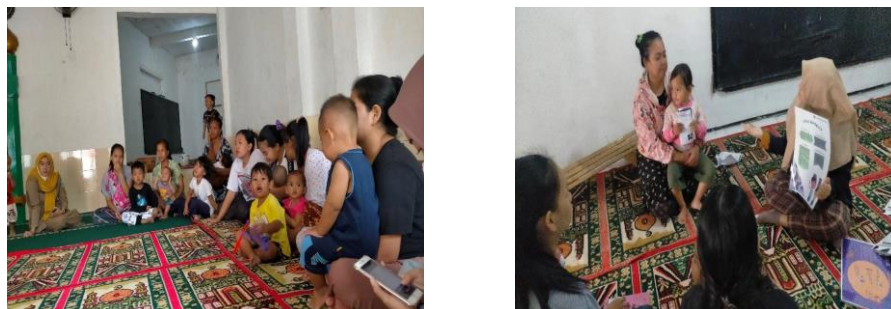
Gambar 5. Kegiatan Sosialisasi Di Ruangan

Penyuluhan kesehatan adalah salah satu upaya peningkatan pengetahuan dengan tujuan agar peserta memiliki pengetahuan dan pemahaman tentang kesehatan serta perilaku hidup bersih dan sehat. Rata-rata nilai sebelum dilakukan sosialisasi adalah 51 dan setelah dilaksanakan sosialisasi adalah 79, jadi ada peningkatan pengetahuan sebesar 28 poin. Kegiatan ini sesuai dengan kegiatan pengabdian sebelumnya yang menunjukkan bahwa ada peningkatan rata-rata nilai pengetahuan sebelum dan sesudah dilaksanakan sosialisasi (Rosidin et al, 2021).