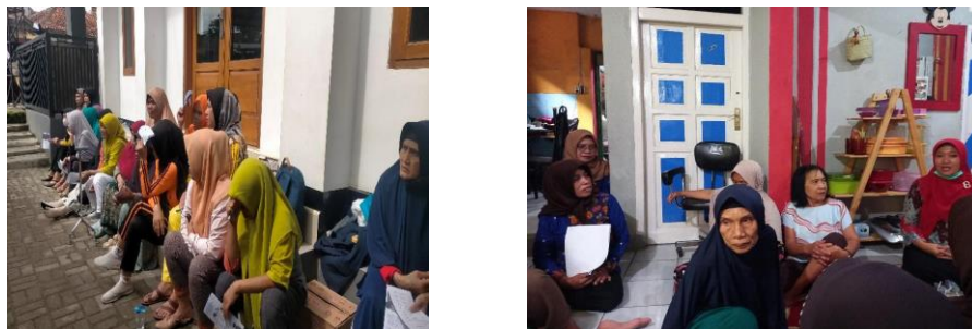
Gambar 4. Kegiatan Sosialisasi Di Lapangan

pada sesi tanya jawab. Keadaan tersebut menunjukkan bahwa masyarakat sangat antusias dan serius mengikuti kegiatan. Kegiatan penyuluhan kesehatan yang dilakukan dapat terimplementasi sesuai dengan rencana dan berjalan dengan lancar karena adanya koordinasi yang baik. Kami juga melakukan koordinasi dengan pihak-pihak terkait seperti pihak kelurahan, pihak puskesmas dan kader kesehatan. Menurut teori L Green (Notoatmodjo, 2019) bahwa perilaku kesehatan dapat dipengaruhi oleh faktor predisposisi, faktor pemungkin dan faktor penguat. Salah satu faktor predisposisi adalah pengetahuan. Dengan pengetahuan yang cukup dimungkinkan masyarakat akan membentuk perilaku yang mahir dalam pengelolaan sampah melalui kegiatan mengurangi, memisahkan dan memanfaatkan. Salah satu upaya peningkatan pengetahuan adalah dengan penyuluhan kesehatan (Suhendar et al, 2020).