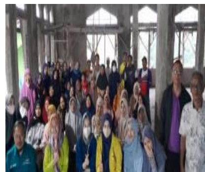
Gambar 3. Rapat Persiapan Kegiatan

Kegiatan penyuluhan kesehatan dilaksanakan secara langsung sesuai dengan waktu yang direncanakan. Peserta memperhatikan materi penyuluhan kesehatan yang diberikan, peserta kegiatan aktif bertanya