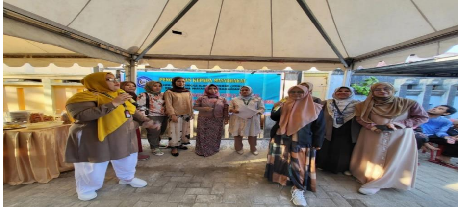
Gambar 3. Pemaparan Materi Kewirausahaan