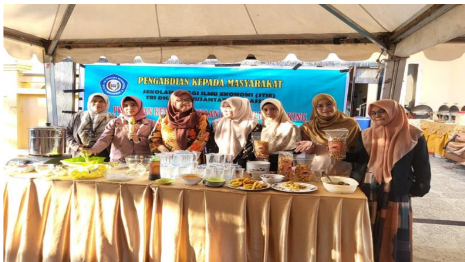
Gambar 4. Foto bersama para pelaksana kegiatan