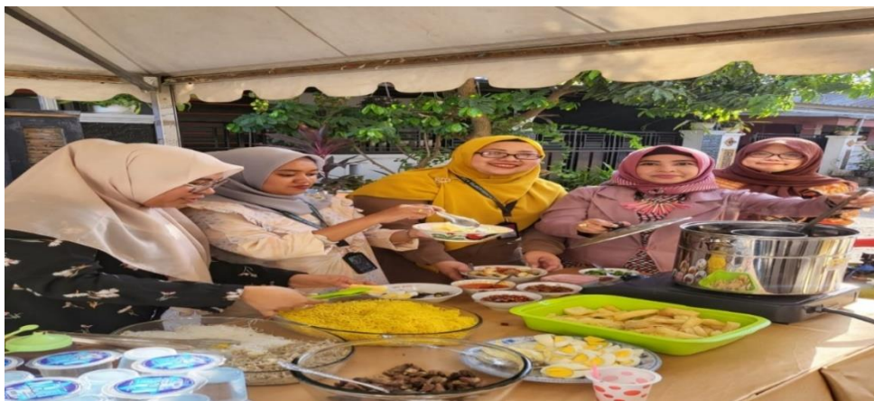
Gambar 2. Praktek Pengolahan Jajanan Kekinian

Setelah pemaparan materi, kegiatan pengabdian ditutup dengan sesi foto bersama peserta dan narasumber, ucapan terima kasih dari tim pelaksana kegiatan pengabdian. Tim pelaksana menyampaikan harapan agar pelatihan yang diberikan dapat bermanfaat bagi masyarakat agar menjadi wirausahawan yang sukses di masa yang akan datang