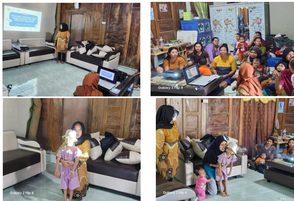
Gambar 2. Pelaksanaan Kegiatan Pengabdian Masyarakat

Dengan hasil dan temuan tersebut, diharapkan program penyuluhan edukasi teknik Heimlich Manuver ini dapat terus ditingkatkan dan dijalankan secara berkelanjutan untuk memberikan manfaat yang lebih luas bagi masyarakat.