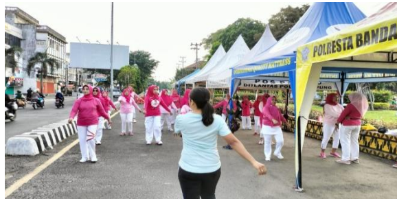
Gambar 2. Pelaksanaan Kegiatan Pendidikan Kesehatan

Hasil wawancara kami dengan beberapa responden didapatkan bahwa responden merasa lebih segar, bugar dan sehat setelah melakukan aktivitas fisik atau senam hipertensi bagi lansia.