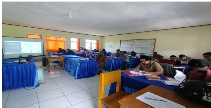
Gambar 2. Pengerjaan Pretest

Hasil diukur dengan membandingkan jumlah jawaban benar pada lembar Pretest dan Posttest yang telah diisi oleh setiap peserta. Sesuai dengan tujuan yakni menyasar aspek kognitif, maka terdapat 5 pertanyaan yang akan mengukur pengetahuan Orangtua sebelum dan setelah adanya psikoedukasi. Diharapkan setelah adanya psikoedukasi pengetahuan peserta mengenai pendidikan seks dapat bertambah yang ditandai dengan meningkatnya jumlah jawaban benar yang diisikan. Nantinya guna melihat efek jangka panjang dari psikoedukasi, akan dilakukan Follow Up dengan memberikan kembali pertanyaan yang sama seperti pada lembar Pretest dan Posttest . Skor pada masing-masing pertanyaan berbeda, bergantung pada pertanyaan tersebut, sehingga skor terendah yang mungkin dihasilkan setiap peserta adalah 0 dan skor tertinggi adalah 20 yang akan dikelompokkan sesuai dengan kategori skornya.