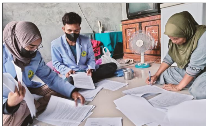
Gambar 4. Kegiatan Kunjungan Rumah ke-3

Selanjutnya pada kunjungan rumah ketiga dilakukan penyuluhan tentang pentingnya menghindari terjadinya luka pada kaki atau tangan, dilanjutkan demonstrasi cara perawatan luka pada penderita DM, kegiatan pada kunjungan rumah ketiga diakhiri pengisian kuesioner post-test pengetahuan tentang penyakit DM oleh penderita atau keluarga.