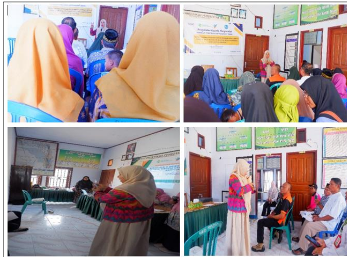
Gambar 2. Pertemuan di kantor Desa Rabakodo Kecamatan Woha

Kegiatan pengabdian masyarakat ini dilaksanakan pada bulan Maret sampai dengan November 2024, diawali dengan koordinasi kepada pihak terkait yang menjadi mitra yaitu Puskesmas Woha Kabupaten Bima Nusa Tenggara Barat, dilanjutkan dengan penjangkaran dan pemetaan calon peserta yaitu keluarga dengan salah satu anggota keluarga menderita penyakit DM sejumlah 30 keluarga yang bertempat tinggal di wilayah kerja Puskesmas Woha. Langkah berikutnya adalah mengumpulkan keluarga-keluarga yang dinyatakan eligible berdasarkan kriteria yang telah ditentukan di aula kantor Desa Rabakodo, dokumentasi kegiatan terlihat pada gambar 2. Pada pertemuan pertama dengan para peserta disepakati beberapa kontrak kegiatan yaitu penyuluhan umum tentang penyakit DM yang dilaksanakan pada pertemuan saat itu, kemudian disepakati juga jadwal kunjungan rumah oleh pengabdi dan mahasiswa yang mana masing-masing keluarga mendapatkan tiga kali kunjungan selama rentang waktu satu bulan.