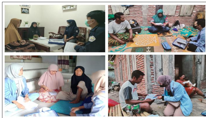
Gambar 3. Kegiatan Kunjungan Rumah Ke-1 dan Ke-2 di Wilayah Kerja Puskesmas Woha

Selama kunjungan rumah pengabdi yang dibantu oleh mahasiswa DIlpoma Tiga Keperawatan Prodi Keperawatan Bima Poltekkes Kemenkes Mataram memberikan perlakuan bertahap yaitu pada kunjungan rumah pertama diberikan pendampingan dan konseling tentang motivasi bagi keluarga untuk mendampingi dan memberikan dukungan bagi penderita DM, penjelasan tentang pilar-pilar penatalaksanaan DM yaitu pengaturan diet dan pola makan serta dan olah raga/aktivitas fisik yang teratur. Kemudian pada kunjungan rumah kedua dilakukan pendampingan dan konseling untuk kontrol gula darah secara teratur, pentingnya memanfaatkan puskesmas sebagai fasilitas Kesehatan tempat penderita dan keluarga mencari pertolongan ketika menderita sakit atau kontrol gula darah.