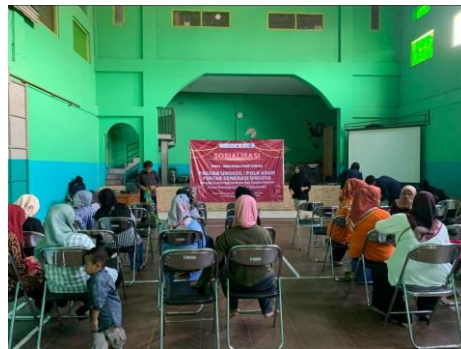
Gambar 2. Dokumentasi Sosialisasi Program Sekolah Perempuan Kepada Peserta.

Program Sekolah Perempuan diakhiri dengan kegiatan graduation dimana pada kegiatan ini para peserta yang mengikuti program sedari awal hingga akhir diberikan apresiasi kelulusan dengan pemberian sertifikat lulus dan souvenir dari tim Pagar Unggul.