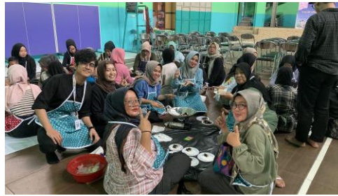
Gambar 4. Kegiatan praktikum memasak.