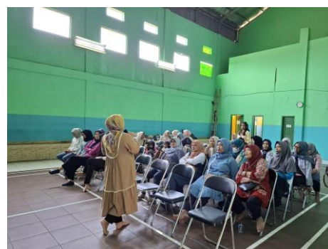
Gambar 3. Pemaparan materi selama kegiatan edukasi kepada peserta.