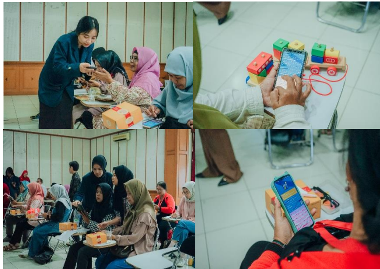
Gambar 3. Metode Tutorial (para pelaku UMKM dibantu oleh mahasiswa)

Dari kegiatan ini, para pelaku UMKM diperkenalkan dengan aplikasi laporan keuangan yang dirancang untuk mempermudah proses pencatatan transaksi usaha secara praktis dan sistematis. Penggunaan aplikasi ini menjadi langkah awal yang penting dalam membangun kebiasaan pencatatan keuangan yang tertib dan terstruktur di kalangan pelaku usaha kecil. Melalui pelatihan dan pendampingan, peserta diajak untuk memahami fungsi-fungsi dasar dari aplikasi tersebut, mulai dari pencatatan pemasukan dan pengeluaran, pembuatan laporan laba rugi, hingga pemantauan arus kas usaha.