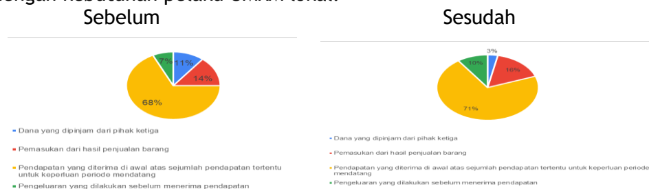
Gambar 5. Pemahaman mengenai "Pendapatan Diterima Dimuka" dalam aplikasi

Hasil dari kuesioner ini menjadi dasar penting untuk perencanaan pelatihan lanjutan, khususnya dengan memperdalam materi mengenai analisis laporan keuangan serta pemanfaatan data keuangan untuk perencanaan usaha. Selain itu, hasil ini juga menunjukkan potensi pengembangan lebih lanjut dari aplikasi yang digunakan agar semakin sesuai dengan kebutuhan pelaku UMKM lokal.