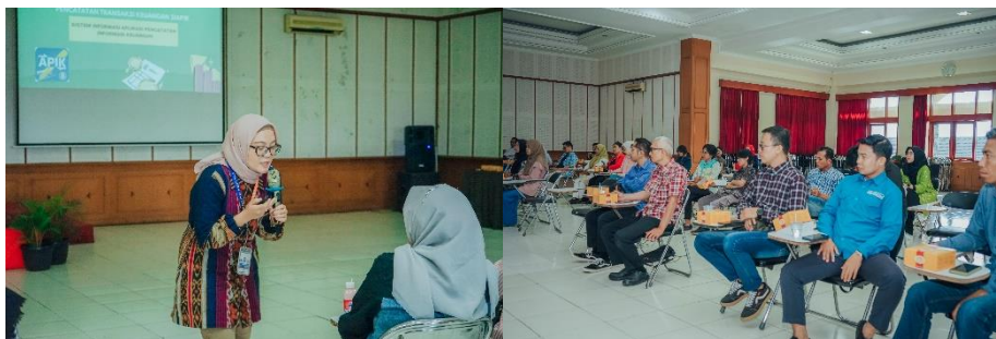
Gambar 2. Metode Ceramah (pemberian materi tentang literasi keuangan dan aplikasi laporan keuangan).

Pelaksanaan pada metode pertama yaitu ceramah diberikan kepada UMKM, penjelasan yang diberikan berupa pengetahuan mengenai laporan keuangan yaitu laporan laba rugi dan laporan neraca. Dilanjutkan dengan melaksanakan pelatihan penggunaan aplikasi keuangan, mulai dari download aplikasi, registrasi, mengisi akun akun yang ada di aplikasi.