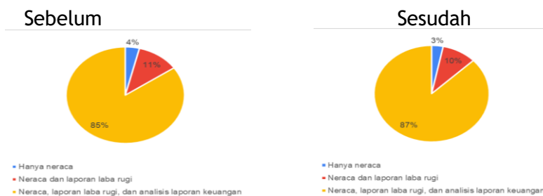
Gambar 4. Laporan yang dapat dihasilkan dari aplikasi SIAPIK

Setelah pemahaman dasar terbentuk, peserta diperkenalkan pada berbagai tantangan umum yang dihadapi oleh UMKM dalam pengelolaan keuangan, termasuk rendahnya literasi digital dan keterbatasan waktu dalam melakukan pencatatan manual. Di sinilah aplikasi pencatatan keuangan menjadi solusi yang relevan dan aplikatif. Dengan tampilan yang sederhana dan fitur yang mudah dipahami, aplikasi ini dirancang agar dapat diakses dan digunakan oleh pelaku usaha dari berbagai latar belakang pendidikan dan pengalaman teknologi yang terbatas. Pendekatan ini menjadi dasar yang kuat untuk mendorong transformasi digital dalam pengelolaan keuangan UMKM. Lebih jauh lagi, penggunaan aplikasi ini juga diharapkan mampu mengubah pola pikir para pelaku UMKM dari pendekatan usaha yang bersifat informal dan tidak terdokumentasi menjadi lebih profesional dan terukur. Dengan demikian, UMKM dapat meningkatkan kredibilitas dan daya saing usahanya di tengah persaingan pasar yang semakin kompetitif. Pengenalan teknologi pencatatan keuangan ini bukan hanya menjadi solusi teknis, tetapi juga menjadi bagian dari proses pemberdayaan pelaku usaha untuk tumbuh secara berkelanjutan dan berorientasi pada pertumbuhan jangka panjang. Evaluasi dari pelaksanaan dilihat dari hasil kuesioner yang diberikan sebelum pelaksanaan dan sesudah pelaksanaan ceramah dan tutorial. Berikut ini merupakan gambar dari hasil evaluasi mengenai pemahaman dari aplikasi dan literasi keuangan: