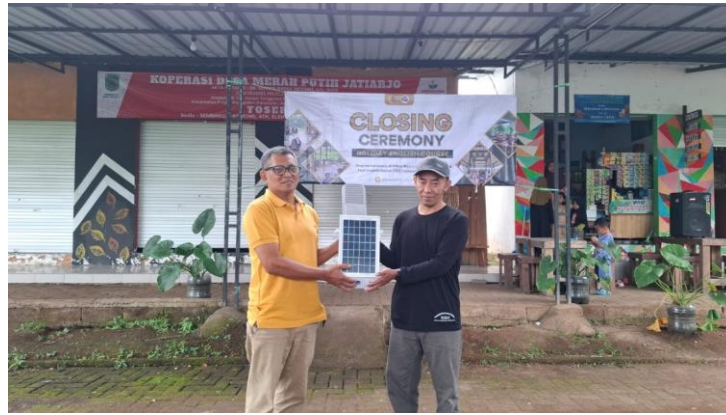
Gambar 7. Penyerahan Panel Surya