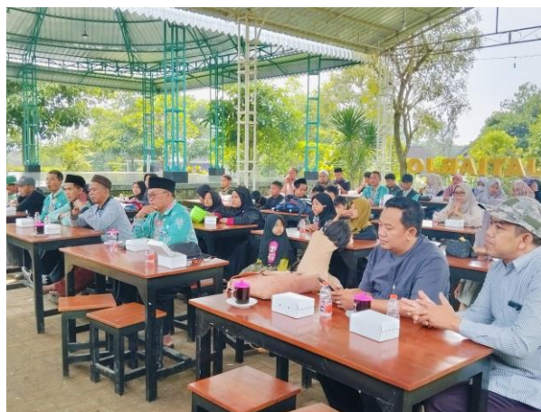
Gambar 6. Pendampingan Pemetaan Unit Bisnis BUMDesa