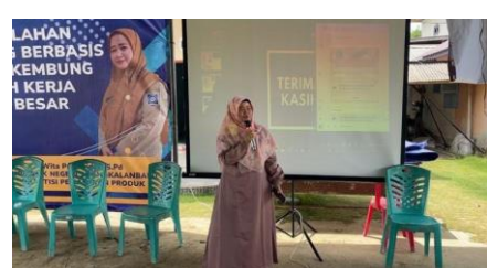
Gambar 2. produksi pelatihan packing dan pendampingan sosialisasi