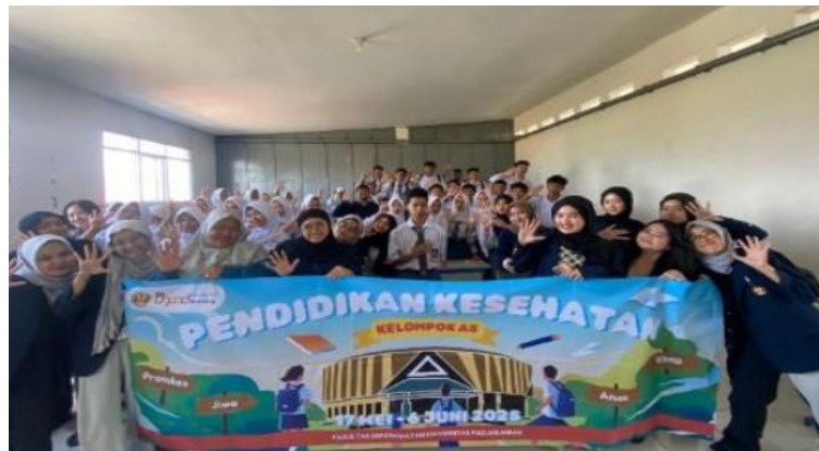
Gambar 4. Foto Bersama setelah Kegiatan

Asumsi peneliti stress akademik bisa diatasi dengan cara manajemen stress yang baik, peningkatan efikasi diri dan mengikuti Pendidikan Kesehatan terutama Kesehatan jiwa, hal ini sesuai dengan beberapa pendapat dalam hasil penelitian yaitu: (Khoirunnisa & Gumiandari, 2023) menunjukkan bahwa metode seperti self-instruction dan peningkatan efikasi diri cukup efektif dalam meredakan stres akademik. Stres akademik dapat menunjukkan emosi, fisik, dan perilaku (Fahmi, 2011). dalam (Sriwahyuningsih & Barseli, 2024). Selain ini dalam Pendidikan Kesehatan juga belajar tentang keterampilan sosial, komunikasi, dan pengambilan keputusan yang penting untuk menjalani gaya hidup sehat. (M., Dr. Sahib Saleh, 2023).