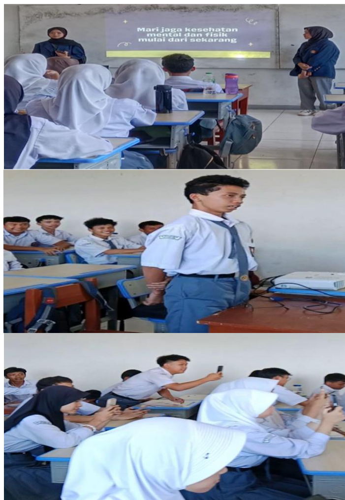
Gambar 3. Foto kegiatan Penyampaian materi ,tanya jawab dan posttest

dalam sesi tanya jawab untuk mendalami pengetahuan tentang stress yang dialaminya dan peserta mampu menjawab setiap pertanyaan yang di berikan oleh pemateri/ panitia. Evaluasi dilakukan dengan tujuan dan indikator evaluasi pendidikan kesehatan dari Aspek knowledge : Meningkatnya pemahaman peserta mengenai konsep dasar stres, kecemasan, serta teknik self-management untuk menghadapinya. Aspek attitude terbentuknya sikap positif dalam menghadapi tekanan dan keinginan untuk menerapkan strategi coping yang sehat. Aspek psikomotorik menuliskan perasaan dalam sticky notes sebagai bentuk harapan dan ekspresi emosi. Waktu evaluasi selama kegiatan dilakukan evaluasi melalui sesi tanya jawab dan post test. Kegiatan diakhiri dengan sharing session dan penempelan sticky notes yang berisi perasaan siswa untuk masuk PTN di pohon harapan.