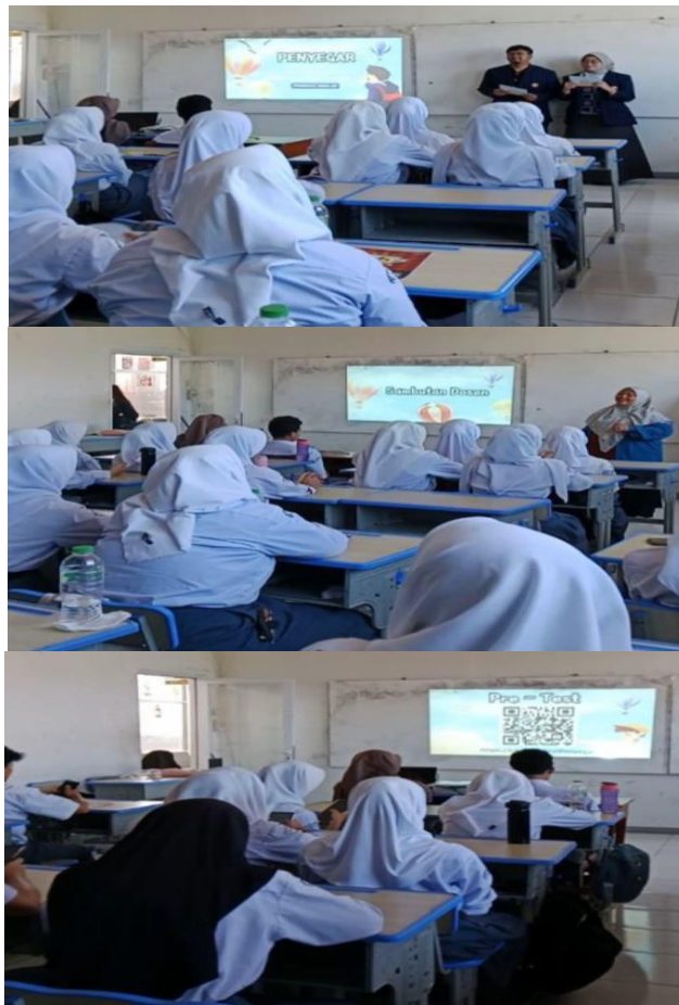
Gambar 2. Foto kegiatan pembukaan dan Pre test

sekolah. Kegiatan ini meliputi pematerian dan diskusi bersama. Sebelum melakukan kegiatan kami melakukan tahap persiapan dan perencanaan, kemudian survei awal, Penyusunan materi edukasi, Kolaborasi dengan pihak sekolah, dalam tahap pelaksanaan, ada sesi pematerian dengan ceramah dan diskusi serta tanya jawab kemudian melakukan evaluasi dan tindak lanjut, melakukan monitoring keberhasilan/efektivitas program. Sasaran dari kegiatan ini adalah siswa kelas 11 sebanyak 40 siswa (1 kelas) di SMA PGRI Rancaekek. Sebelum kegiatan dilakukan di mulai dengan pre test untuk mengetahui sejauh mana pengetahuan yang dimiliki oleh siswa yang berkaitan dengan stress yang dialami siswa mau melanjutkan ke PT.