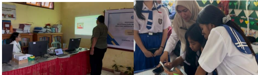
Gambar 2. kegiatan PKM

muncul dalam bentuk kategorik yaitu tidak berisiko, berisiko kecil, berisiko sedang dan berisiko besar.