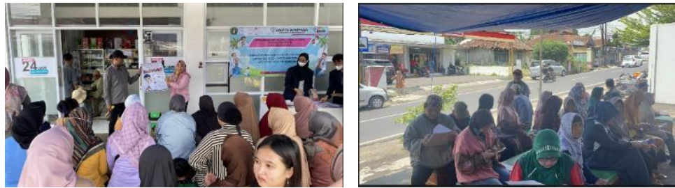
Gambar 2. Kegiatan Pelaksanaan Penyuluhan