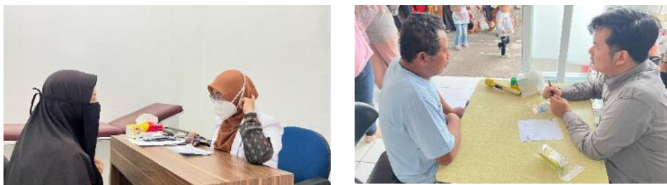
Gambar 3. Pemeriksaan Kesehatan oleh Dokter dan Pelayanan Informasi Obat (PIO) oleh Apoteker

Lansia (lanjut usia) adalah tahap kehidupan manusia yang ditandai oleh perubahan fisik, psikologis, dan sosial. Seiring bertambahnya usia, tubuh mengalami banyak perubahan yang mempengaruhi berbagai sistem organ. Perubahan yang umum meliputi sistem kardiovaskular berupa penurunan elastisitas pembuluh darah, peningkatan resiko hipertensi, dan penurunan efisiensi kerja jantung (Agustini et al., 2025). Hal ini sejalan dengan hasil pemeriksaan kesehatan yang dilakukan pada kegiatan pengabdian, di mana penderita hipertensi terbanyak adalah pada rentang usia 61-70 tahun (46,9%) atau sebanyak 23 orang dari 49 peserta yang terdeteksi hipertensi.