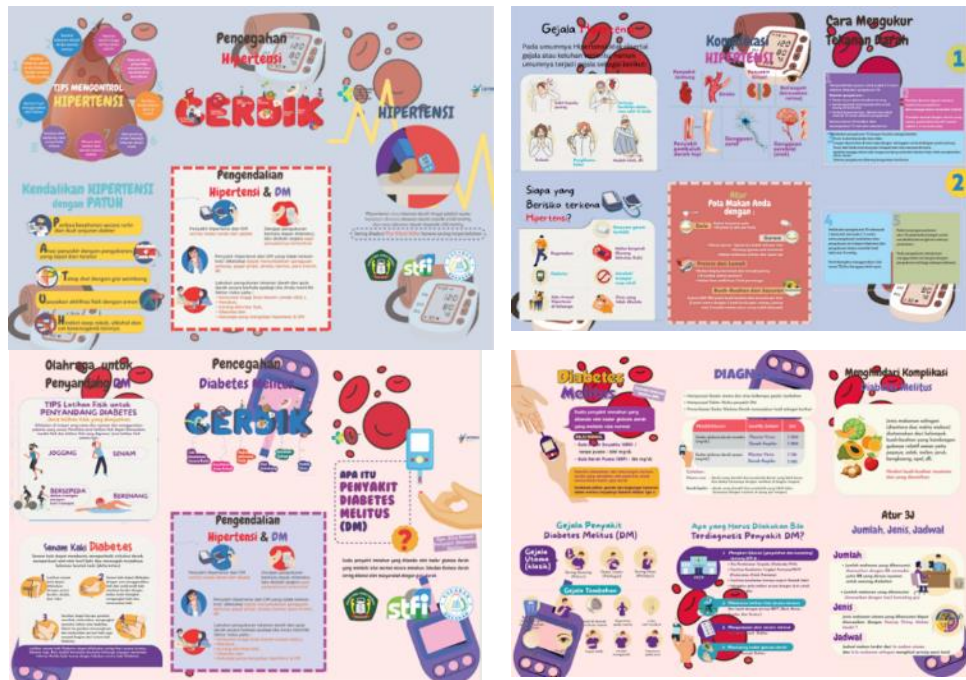
Gambar 3. Flyer Mengenai Diabetes Melitus dan Hipertensi

Berdasarkan tabel 1 peserta yang mengikuti kegiatan pengabdian ini terdiri dari 25 orang laki-laki dan 75 orang perempuan dengan rentang usia yang beragam dari 20 sampai dengan 80 tahun.