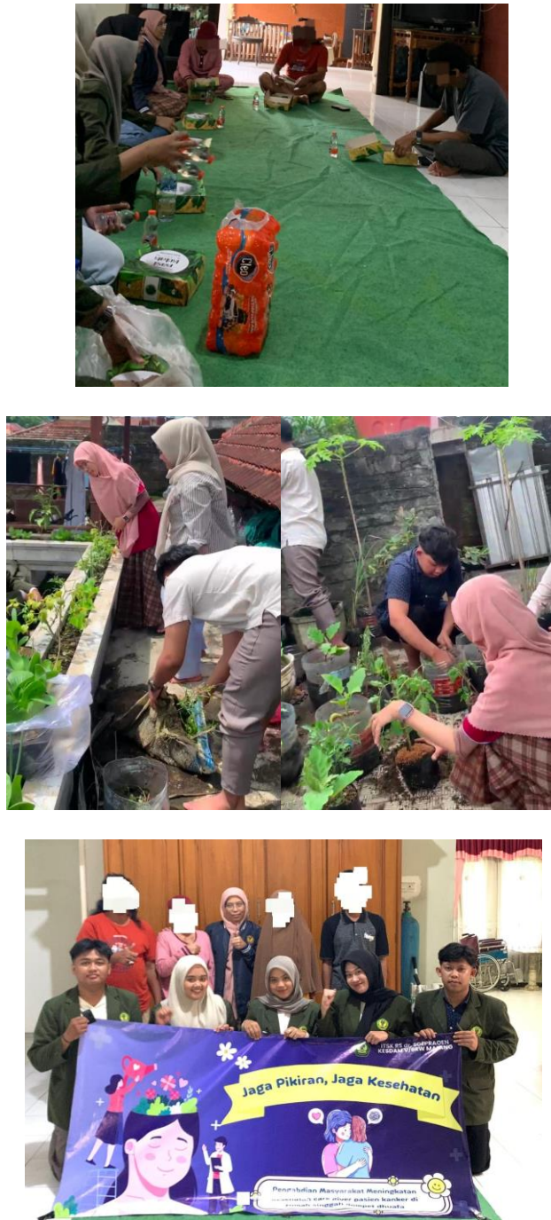
Gambar 3. Kegiatan Psikoedukasi dan Pemberdayaan Caregiver penanaman sayuran di area Rumah Singgah Pasien Dompot Dhuafa Malang