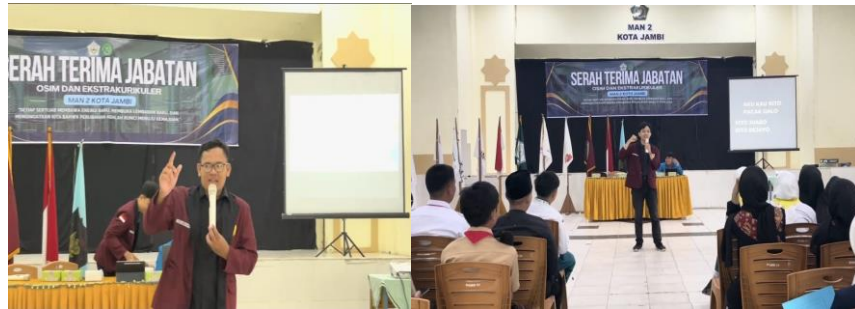
Gambar 2. Penyampaian materi kepemimpinan dan wicara publik

Kegiatan Pengabdian kepada Masyarakat (PKM) yang diselenggarakan di MAN 2 Kota Jambi pada 22 Oktober 2025 berlangsung mulai pukul 08.30 hingga 11.00 WIB dan melibatkan sekitar 130 siswa yang tergabung dalam kepengurusan berbagai ekstrakurikuler. Pelaksanaan kegiatan dirangkaikan dengan prosesi pelantikan pengurus serta serah terima jabatan ketua ekstrakurikuler, kemudian dilanjutkan dengan penyampaian materi yang difasilitasi oleh dua orang narasumber dari tim PkM.