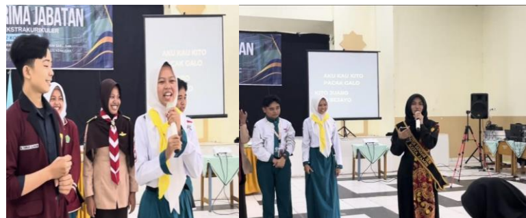
Gambar 3. Keaktifa Peserta Pkm Dalam Mempresentasikan Dan Menjelaskan Kembali Materi Yang Disampaikan

Kegiatan diawali dengan kata sambutan dari waka kesiswaan MAN 2 Kota Jambi dan dilanjutkan dengan kata sambutan dari ketua pelaksana program PkM. Seluruh rangkaian kegiatan difokuskan pada penguatan pemahaman siswa mengenai kepemimpinan dan wicara publik, yang disampaikan melalui ceramah interaktif, diskusi kelompok, simulasi kepemimpinan, dan latihan berbicara di depan kelompok kecil. Berdasarkan hasil observasi lapangan, siswa menunjukkan antusiasme tinggi dalam mengikuti sesi materi dan diskusi, serta berpartisipasi aktif dalam simulasi yang diberikan. Hasil umpan balik tertulis maupun lisan menunjukkan bahwa sekitar 90% peserta mampu menjelaskan kembali konsep dasar kepemimpinan dengan tepat dan memahami peran mereka sebagai pengurus organisasi. Hal ini dibuktikan dengan kemampuan siswa dalam menyampaikan argumen dan menjawab pertanyaan yang diberikan oleh narasumber. Di sisi lain siswa juga mampu menjelaskan kembali dari materi yang telah disampaikan.