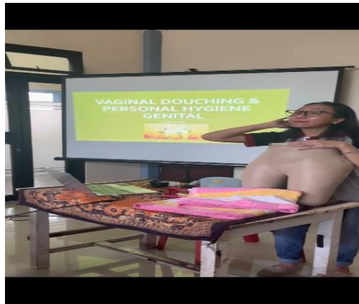
Gambar 3. Proses Emotional Demonstration (emo-demo)

dengan memaparkan materi melalui power point (PPT) dan dijelaskan oleh tim.