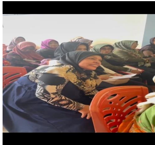
Gambar 4. Proses Diskusi dan Tanya Jawab

Gambar 3 menunjukkan Emotional Demonstration (emo-demo) oleh tim kepada peserta pengabdian masyarakat.