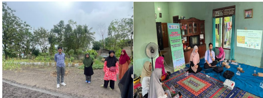
Gambar 3. Koordinasi dan Sosialisasi dengan mitra

Pada tahap awal untuk melakukan kegiatan ini tim pelaksana (dosen dan mahasiswa UNBL) melakukan persiapan kegiatan yang berkoordinasi dengan tim mitra.