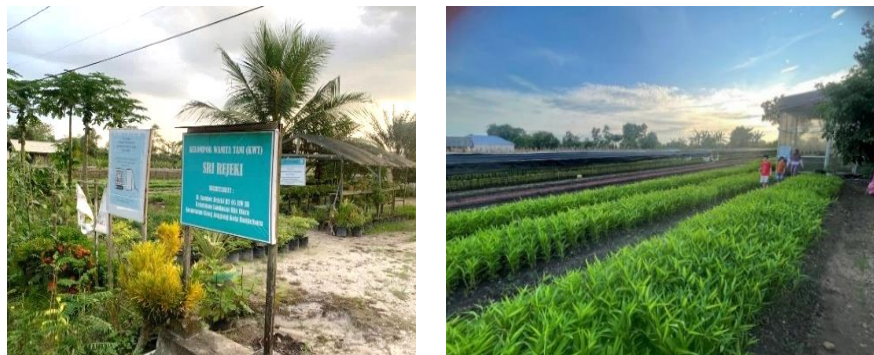
Gambar 1. Lokasi Pengabdian Masyarakat, KWT Sri Rejeki

Di wilayah Kalimantan Selatan, konsep eduwisata herbal belum banyak dikembangkan. Baru terdapat satu UPTD Kebun Raya Banua yang dikelola oleh Instansi Pemerintahan yaitu Badan Riset Daerah Kalimantan Selatan yang mengelola keanekaragaman hayati tumbuhan endemik kalimantan (Pergub Kalsel, 2022), namun belum terdapat eduwisata yang dikelola langsung oleh masyarakat. Wilayah LAURA memiliki potensi pengembangan pariwisata. KWT Sri Rejeki saat ini sendiri mulai merintis sektor usaha pariwisata dibina UPT. BPP Liang Anggang namun masih belum terkonsep dengan baik dan minim fasilitas.