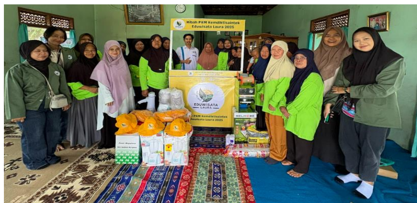
Gambar 6. Serah terima Produk Inovasi dan Teknologi

Pada penerapan teknologi terdapat beberapa alat-alat yang digunakan seperti portable booth , slow juicer dan cup sealer .