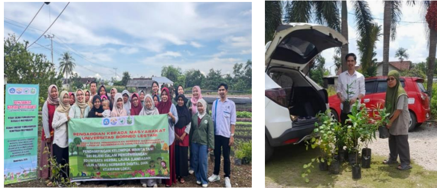
Gambar 4. Pelatihan perencanaan usaha dan brosur eduwisata