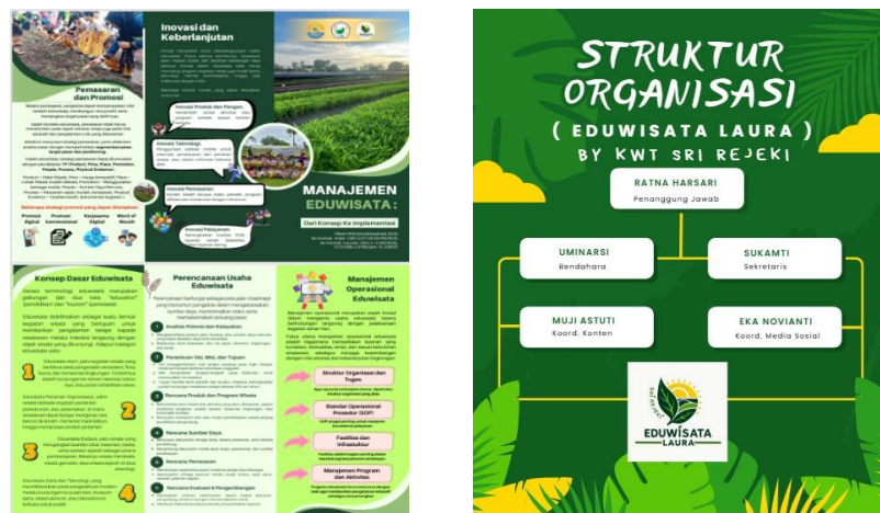
Gambar 5. Brosur dan Struktur Organisasi Pengelola Eduwisata Laura