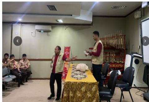
Gambar 2. Demonstrasi BHD

materi diberikan, peserta mengisi pretest dan dilanjutkan dengan kegiatan metode ceramah dan demonstrasi. Berikutnya semua peserta mendapat kesempatan mempraktikkan cara RJP yang benar dengan menggunakan manekin secara bergantian. Hasil evaluasi sebagian besar siswa (89%) memahami dan mengerti tentang bantuan hidup dasar dan mampu mempraktekkan RJP dengan benar kepada manekin. Berikut Gambar pelaksanaan kegiatan